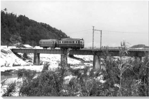
大袋鉄橋をわたるデハ203号と750号