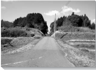
三崎地内に残る電車道跡