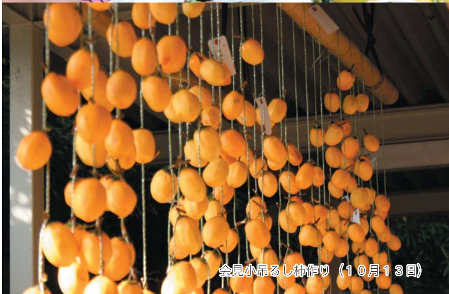
会見小吊るし柿作り（10月13日）