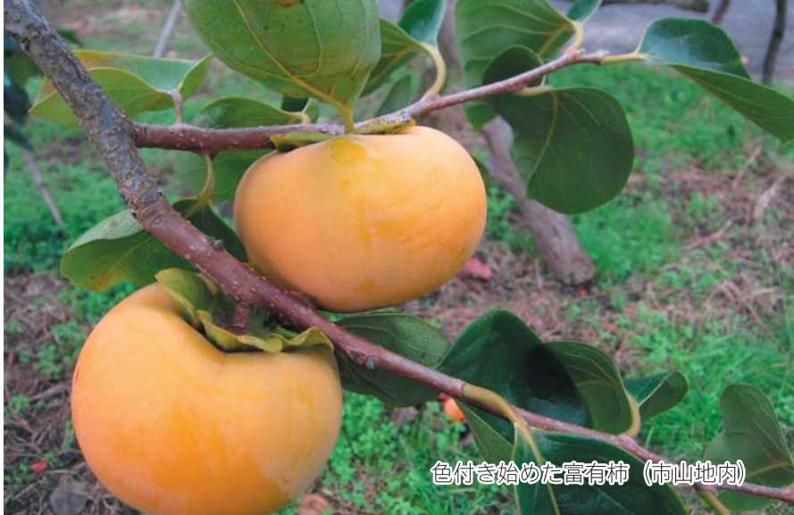
色付き始めた富有柿（市山地区内）