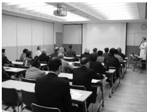
昨年度の健康講座の様子