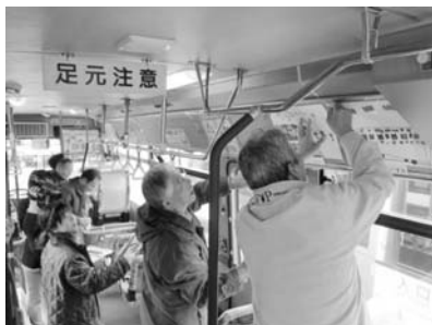
日ノ丸バス御内谷線存続委員会(あいみ富有の里地域振興協議会、あいみ手間山地域振興協議会、日ノ丸自動車(株)、鳥取県、南部町で構成)による展示作業

※本事業は、「鳥取県みんなが乗りたくなるようなバス路線を育てる実践活動推進モデル事業」採択事業です。