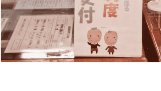
一般質問の詳細は、南部町立図書館において議会議事録をご覧ください。

昨年全国で、一万件以上の戸籍、住民票の不正取得が発覚し、五人の行政書士等が逮捕された。 県内においても現在、二十三日の不正取得が判明した。 南部町は、弁護士、司法書士等の特定八業士が、不正に職権で個人情報を得ることを防止するため、住民票等の不正取得防止のための事前登録を八月から開始した。制度に係わる理由、目的の周知のため、町民の皆様にも更なる広報、研修も必要と考えるが今後の計画について伺う。