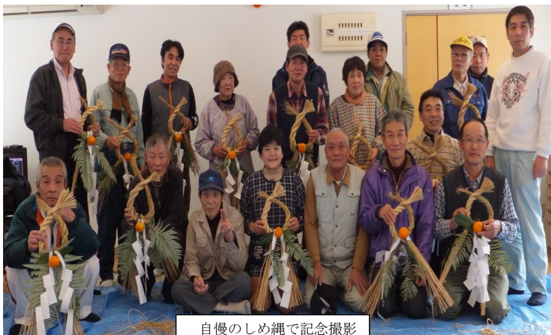
自慢のしめ縄で記念撮影

例年、参加者が少ないため今年は、両長田合同で行いましたが、皆様のご意見、ご感想を協議会までお願いします。