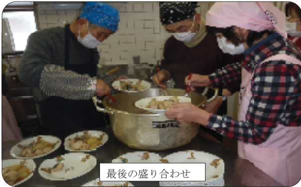
最後の盛り合わせ

1月19日（日）青年の家で男性の料理教室を開催しました。 日頃、慣れないエプロン姿で腕を振るい、かき雑炊、ぶり大根、エビとアボガドの春巻き、長いものバター焼き、いのしし肉の巻き巻き焼きの5品に挑戦。 見事に出来上がり、大変美味しく食事会ができました。