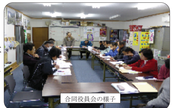
合同役員会の様子

2月6日(木) 協議会事務所にて活動部の合同役員会を開催しました。地域づくり計画の見直しと平成26年度の行事活動計画を各活動部から報告がありました。詳しくは、3月の評議会にて報告する予定にしています。