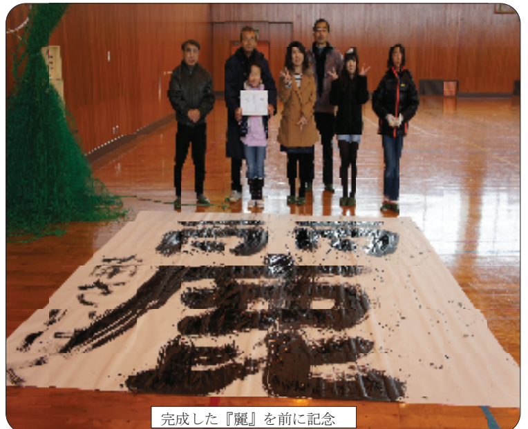
完成した『麗』を前に記念