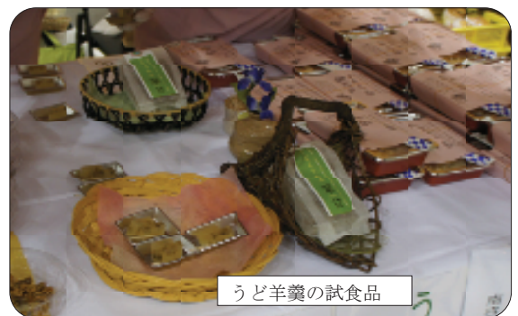
うど羊羹の試食品