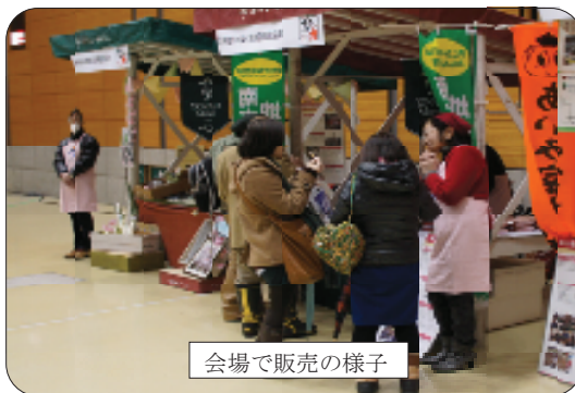
会場で販売の様子