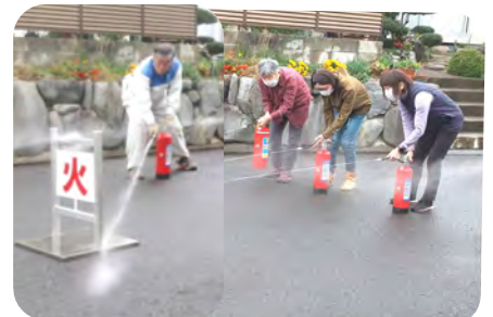
緊迫感のある消火の姿勢