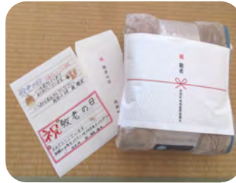
記念品のあつたか敷布