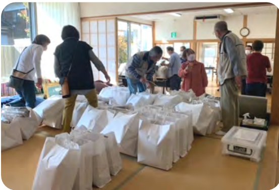
実行委員会で分担しお届けしました