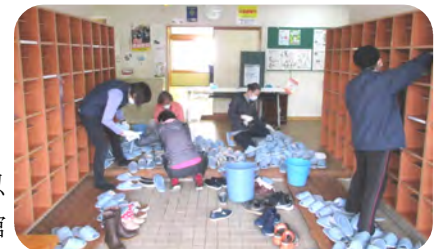
下駄箱やスリッパもスッキリ

また、来年度4月から施設管理として交流センターや大園園スクエアと同じように月曜日・祝日・年末・年始を休館にさせていただくことにいたしました。