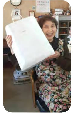
笑顔で受け取っていただきました