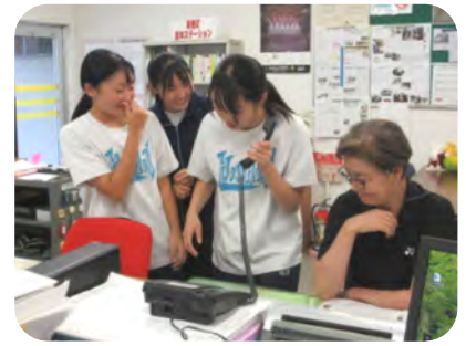
中学生3名が防災放送を使ってお祝いメッセージを行いました