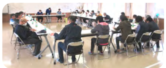
会議にも多くの方が参加されました