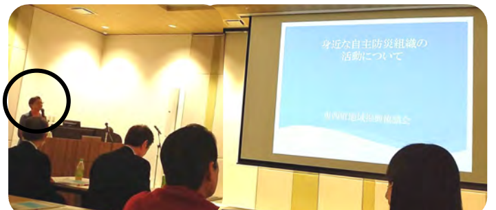
東西町の防災の取り組みについて発表する黒木事務局員