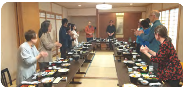
ベビーちゃんから小学生・高校生も参加してくれました