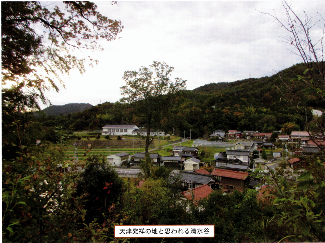
天津発祥の地と思われる清水谷