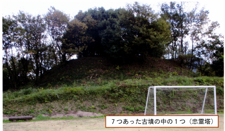
7つあった古墳の中の1つ（忠霊塔）

ふるさと交流センターのある周辺を清水谷遺跡といい、縄文期から室町期にかけて遺跡が数多く出土しています。縄文土器や弥生時代の住居跡、古墳群からは棺も出土しています。縄文期の天津平野は海で母塚山の麓、清水が湧き出る谷からは遠くに大山が見える素晴らしい立地、狩や漁、作物を手安く得られた良い生活を人々はしていたと想像します。