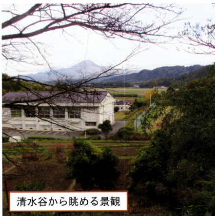
清水谷から眺める景観