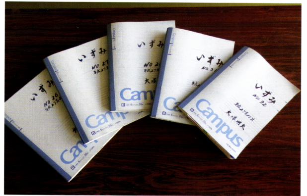
スクラップノート「いずみ」

各戸に配布するので、読む人のためになるように心掛け、発行月が近くなると編集委員会を招集し、企画、原稿依頼、取材、レイアウト、デザイン、原稿校正、入