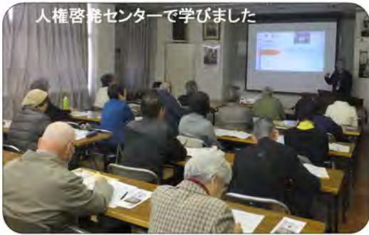
人権啓発センターで学びました

12月9日(金)東西町人権学習会を今年は、地域を離れ非日常のゆったりとした時間の中で自分を振り返り、親睦を深め住み良い社会を目指そうと、岡山県に行きました。