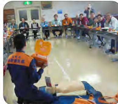
AED説明会にも真剣な参加者