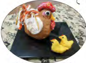
講座作品:干支の酉