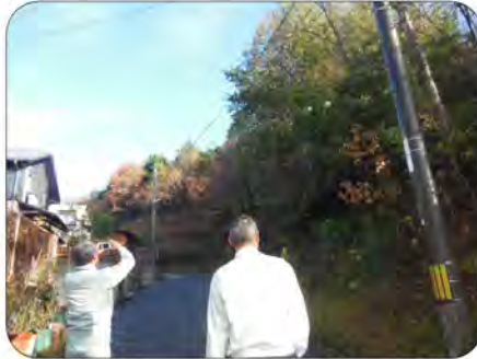
現地を確認しました