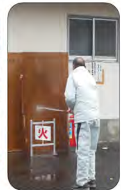
壁の跳ね返りで消火って難しいな～