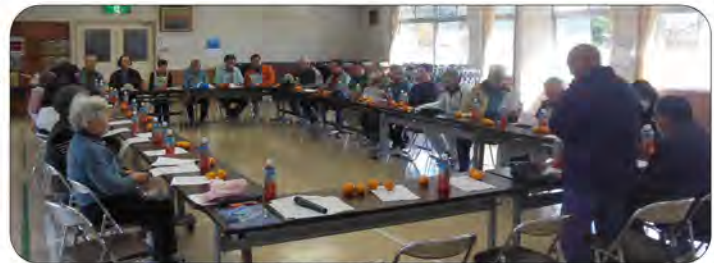
会議にも全員参加されました