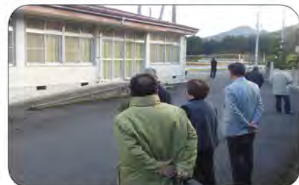
コミセン全館の視察をされました

12月15日(木)南部町議会議員の皆さんが、東西町地域振興協議会が指定管理を受けているコミセンの視察に来られました。