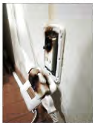
実際に出火したコンセント

コンセントやプラグのほこりに注意! 年末に大掃除をされたことと思います。コンセントにほこりが付いたことで発生するトラッキング火災を防止するためにも、コンセントや差し込みプラグを定期的に点検し、清掃するよう心がけましょう。