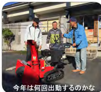
今年は何回出動するのかな