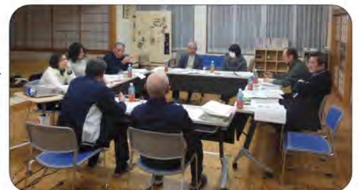
第1回目の検討委員会

第1回は、①と②について協議していただきました。委員からは、●未加入者への加入促進対策に具体策を ●全体的な事業のボリュームが多すぎる、事業を精査する必要があるのでは ●同じような行事を合同で開催しては ●高齢者に対する事業や子供育成事業は益々大切となる ●スタッフの掘り起しや呼び込む手法を工夫すること ●必要性に応じて優先順位で整理してはどうか等、多くの意見が出ました。