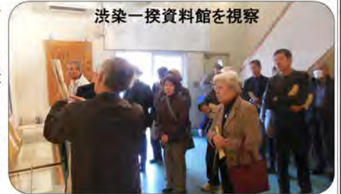
渋染一揆資料館を視察

帰り際に、後樂園を足早に散策し帰路につきました。終始和やかな雰囲気の人権学習会でした。