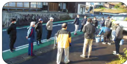
生活に密着する課題に対応し活躍する町づくり部