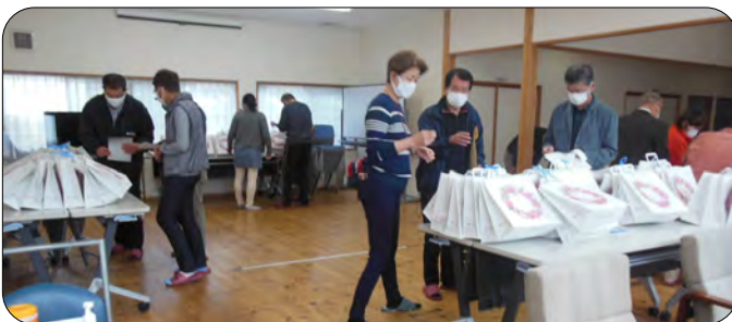
福祉部員と事務局が分担を決めてお届けしました