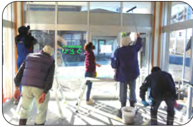
つどい玄関のガラス掃除

今年は、コミセンの床のワックスがけと天井に設置してある換気扇の清掃を業者をお願いしましたので、皆さんには、窓や照明、エアコン、下駄箱等を掃除していただきました。約50分程でとてもきれいになりました。ありがとうございました。