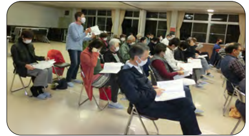
多くの質問がありました(2区)