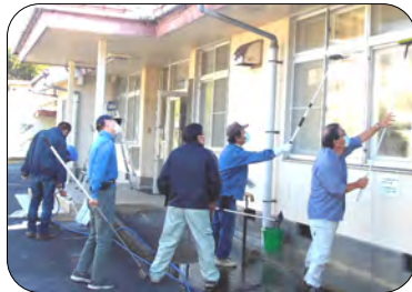
コミセンの窓掃除

清掃後全体会議を行い、事務局から施設利用の心得や改善点等についての説明や、多発するエアコンや換気扇の消し忘れ等に注意していただくようお願いしました。