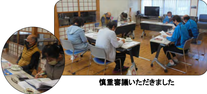
慎重審議いただきました

2名の監事によって、令和3年度の前期の東西町地域振興協議会事業の進捗状況及び、各会計の執行状況や口座残高の確認をしていただきました。