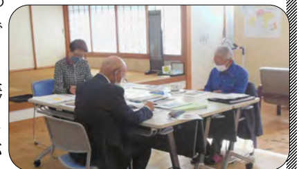
11月18日11回目の編集委員会