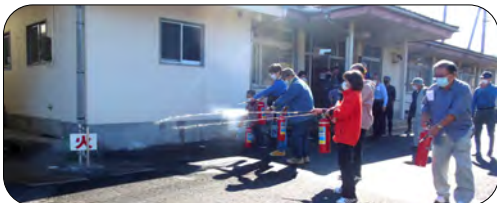
15秒の間に有効な消火を