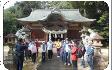
最終目的地の天萬神社