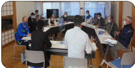
デジタル推進課から説明がありました

引込工事については、個別に説明に回られ、令和4年度～5年度の間に行われる予定です。