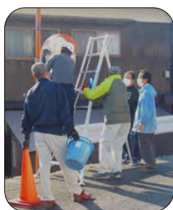
二手に分かれて清掃と調整をしました