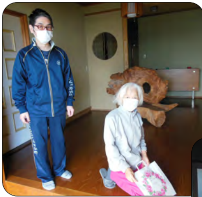
いつまでもお元気でいてくださいという気持ちでお届けしました。にこやかに受け取っていただきました。

皆様のご健康をお祈りするとともに、新型コロナウイルスが収束し、安心して日常生活や交流ができることを願っています。