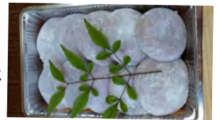
やわらかい芋もち

年末を心温かく過ごしていただきたいという思いで、該当の皆様にもちをお届けします。