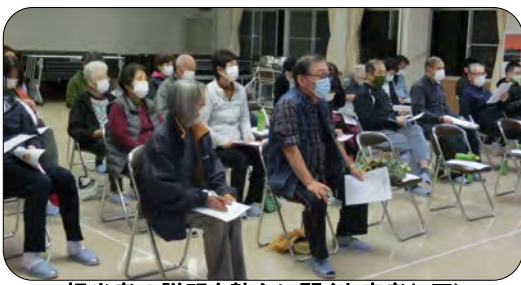
担当者の説明を熱心に聞く出席者(2区)