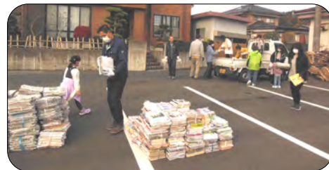
呼びかけに集まっていただきました

西伯小学校主催のリサイクル活動が実施されました。今回から万寿会も一緒に協力していただくことになりました。11月21日(日)開始時刻の9時になっても参加者が非常に少なかったため、急遽、放送で協力を呼びかけたところ、多くの方が来られ、新聞紙・雑誌・ダンボール・アルミ缶の荷降ろしを行っていただきました。