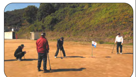
20名の参加者で楽しみました