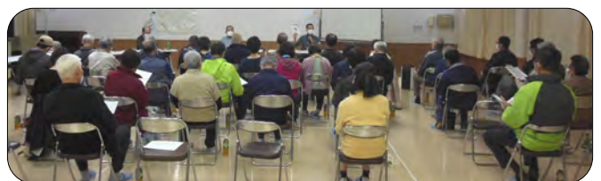
熱心に説明を聞く出席者