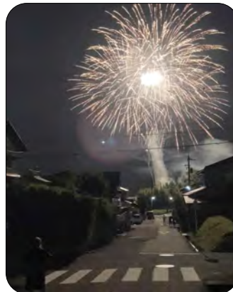
2位 福島秀則さん(3-2) 自宅前の道路から見た花火