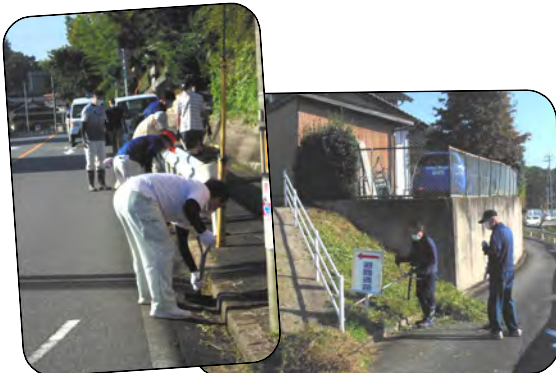
町・人協働で公共スペースの草刈り整備作業