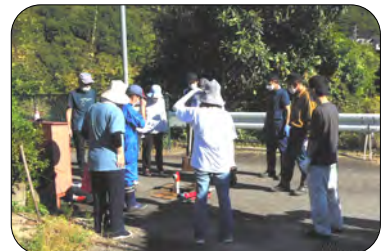
清掃後に行われた消火栓とホース接続訓練にも全員で参加