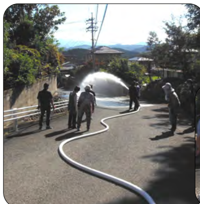
1区2班 消火栓とホース接続訓練(放水)参加の様子