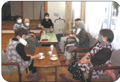
ケーキも欲しいというリクエストが...

10月16日(土)、わくわくショップを開催しました。「喫茶はまだですか〜！」という声にお応えし、1年半振りに喫茶を再開。