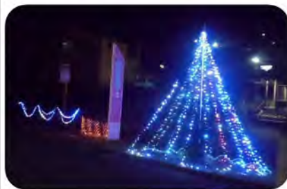
今回のデザインはどうだったでしょうか？

モミの木の植樹やイルミネーションの配置等、役員5名で8時から12時前までかかりましたが、寒い冬が少しでも楽しく明るくなればという想いを込めて設置しました。