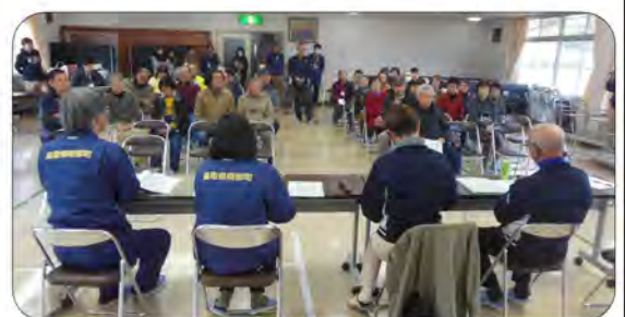
訓練後行なった反省会にもたくさんの方が参加されました