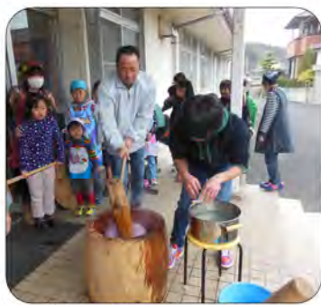
総勢75名のもちづくりでした