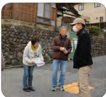
目線を合わせて優しく声かけ