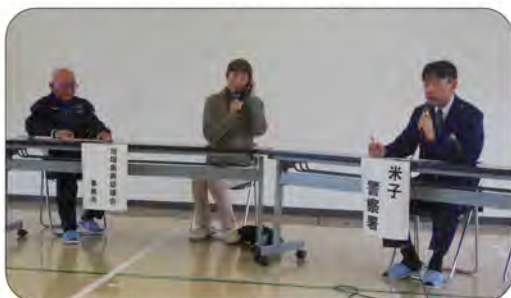
【寸劇】「夫が帰って来ない」と協議会(左)に相談し、警察(右)に電話で行方不明の届け出をする家族(中央)

事務局では、訓練を通して見えてきた課題を整理し、早速、イザという時の備えを完了しました。