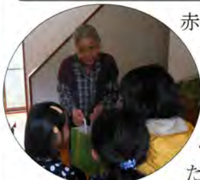
子供達がお届けしました

赤い羽根共同募金受配事業として、12月23日(祝)に、実行委員会で行いました。独居高齢者等の対象の方に、寒い冬に心温まって年末を過ごしていただきたいという思いで、今年も、食べやすいように芋もちを作