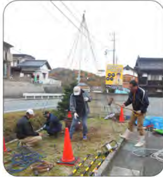
どんな風にするかな～

青少年育成会が昭和63年から続けているイルミネーション設置作業を、12月6日(日)に行いました。26年までは、地主様のご厚意で、つどい前のふれあい花壇に設置していましたが、昨年は暫定的にマンション入り口に設置しま