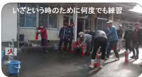
いざという時のために何度でも練習