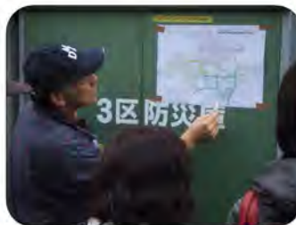
捜索範囲分担図で捜索協力員を配置