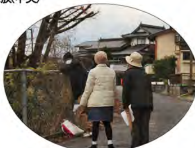
行方不明者情報を元に声かけを行う捜索協力員