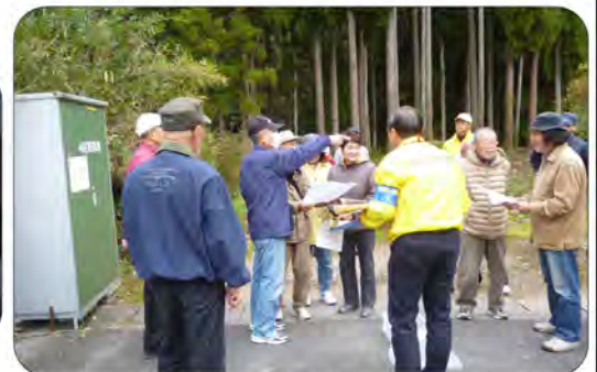
ブロックごとに担当を決めて捜索開始 たくさんの方の協力がありました