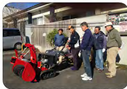
除雪機使用講習会の様子

募集したところ、6名の申込みがあり、12月20日(日)除雪機使用講習会を行いました。雪のない講習会でしたが、真剣に除雪機操作に取り組んでいただきました。