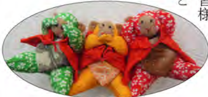
27年度干支づくり講座作品(申)