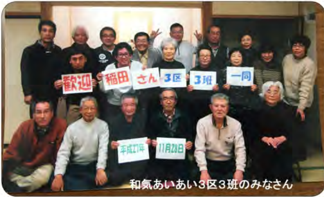
和気あいあい3区3班のみなさん