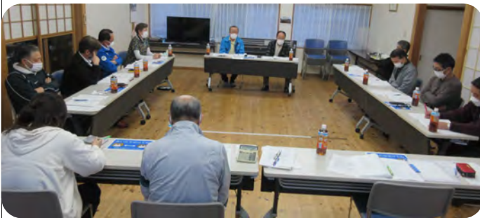
3時間にも渡る運営委員会でした