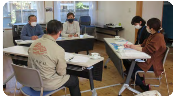
ヒアリングに対応する小杉会長と黒木事務局員