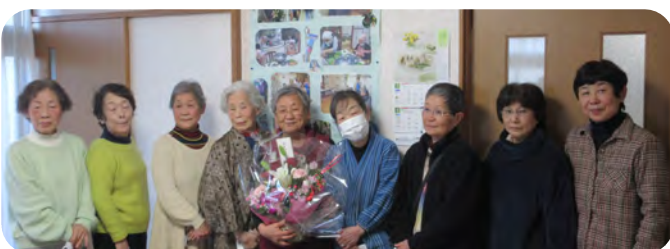
サポート員からも花束が贈られました

「西町の郷」は今後も、サポート内容を見直しながら継続しますので、いつまでも元気に地域で住み続けるための日中の居場所として、どうぞご利用ください。