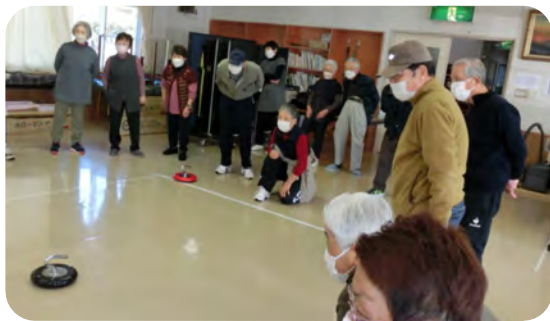
コミセン 大集会室 で楽しみました