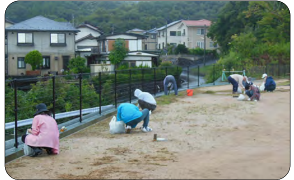
早朝から多くの方が参加してくださいました