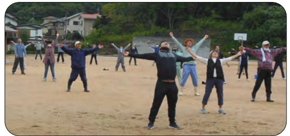
後日の体の痛みは正しい体操の成果です