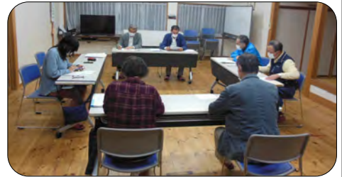
つどいで行われた企画会議

あいみ手間山地域振興協議会のエプロンで芋もちを制作し、お届けする予定にしています。