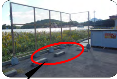
プラスチック類はこの辺りに置いてください