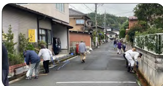
班員総出の一斉清掃