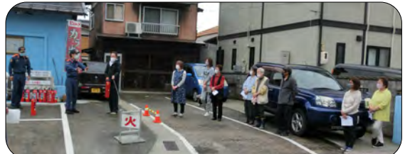
班を順番に回って消火器使用講習会を行っています。今回は、3区1班でした。消防署員から説明を受けながら22名の参加者が水消火器で訓練をしました。