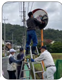
カーブミラーの整備