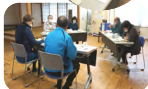
細かなところまで及んだ監査でした