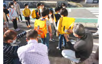
安全に通学してね！