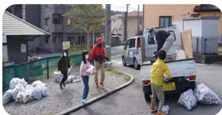
万寿会の方等と一緒にいったリサイクル

この利益はとても僅かですが子ども達が参加する事業などに充てられます。どうぞご理解いた