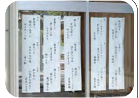
つどいででの掲示

先月号「タビ」のお題で募集しましたところ、13名の方から31句が寄せられました。ありがとうございました。