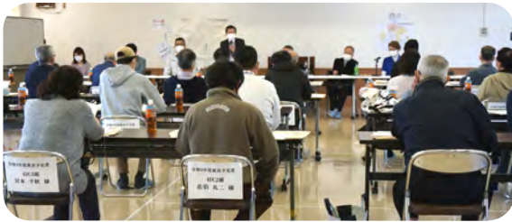
新年度区長・班長会の様子

また、町文書の配布や回覧板を回す負担の軽減や資源の有効活用、印刷代の削減等から町と連携して町文書のペーパーレス化に取り組んでいきたいと思っています。町のデジタル推進課等から4名にお越しいただき説明をしていただきました。