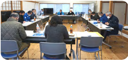
長時間に及んだ令和3年度最後の運営委員会