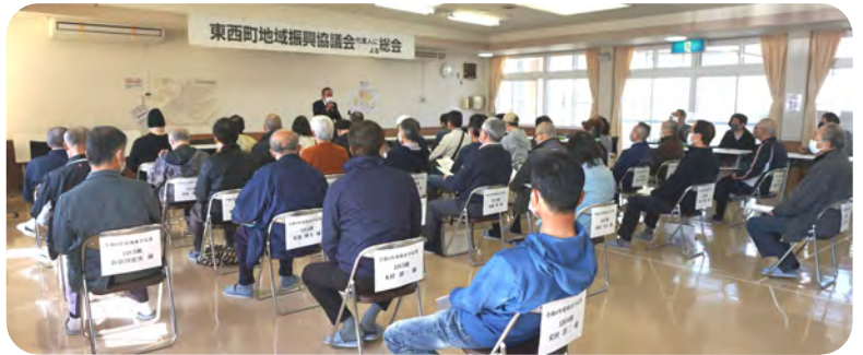
代理人として新年度理事・班長の皆さんにご出席いただきました。