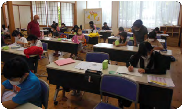
涼しいついでに集中して勉強できました