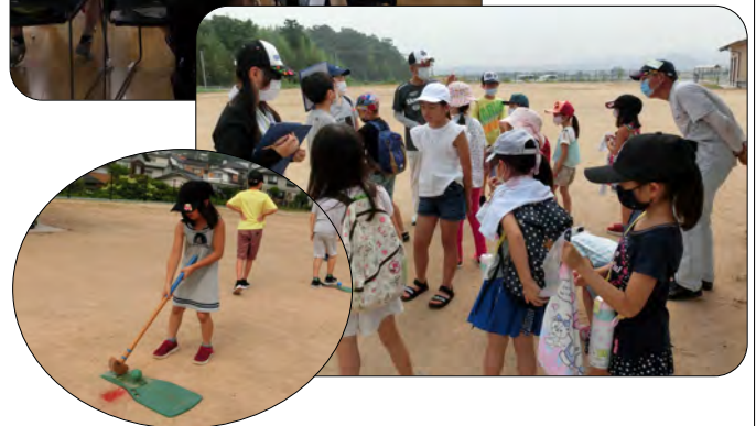
グラウンドゴルフや防災学習会等でお世話になりました