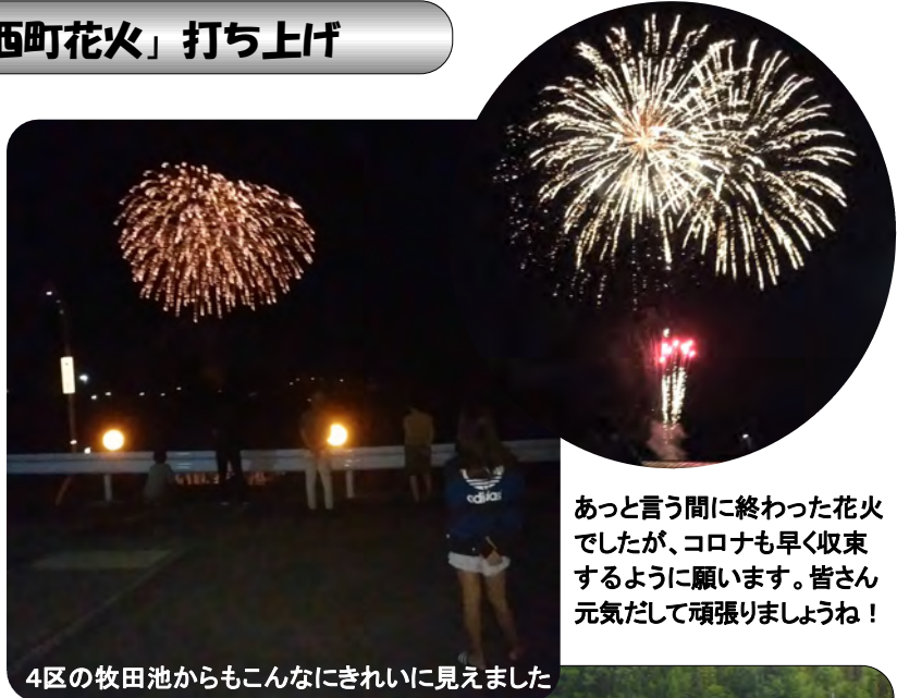
4区の牧田池からもこんなにきれいに見えました

あっという間に終わった花火でしたが、コロナも早く収束するように願います。皆さん元気だして頑張りましょうね！