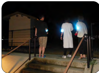
東西町スポーツ広場もパトロール