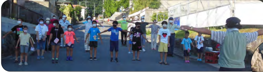
4区会場のラジオ体操とスタンプ押しの列