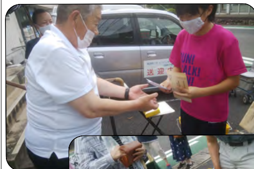
ふれあい通貨でお支払い

ふれあい健康づくりポイント制度で交換したふれあい通貨(地域通貨)の利用が8月から開始されています。早速1日に開催された野菜市でもふれあい通貨で支払いをされている方がおられました。