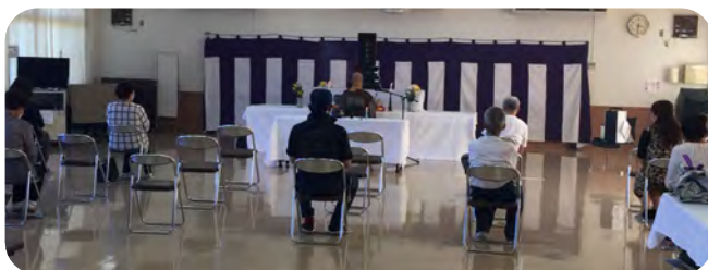
間隔を空けてご供養しました