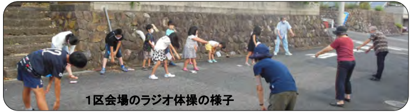
1区会場のラジオ体操の様子