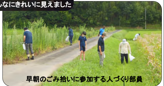
早朝のごみ拾いに参加する人づくり部員

あっという間に終わった花火でしたが、コロナも早く収束するように願います。皆さん元気だして頑張りましょうね！