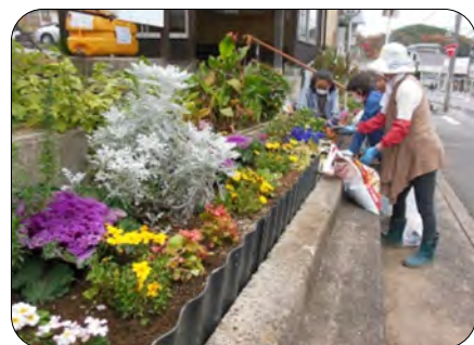
花柄摘みにご協力をお願いします