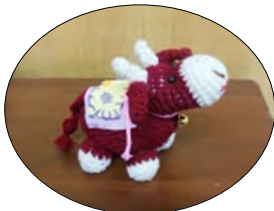
毛糸で編まれた 干支「丑」

ウィズコロナやアフターコロナといわれる新しい生活様式の中で感染防止に留意しながら、安全安心な町づくりのためのふれあいと交流を前に進めていければと思っています。東西町が更に住み良く、「お互いさま」と「ありがとう」の気持ちが未来につながっていくことを期待して新年のご挨拶とさせていただきます。