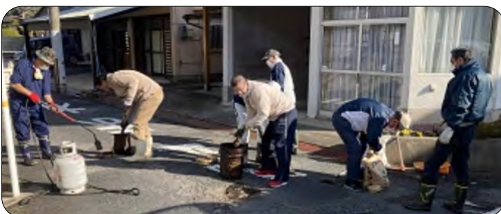
プロ顔負け、段取り良く進んだ道路補修作業