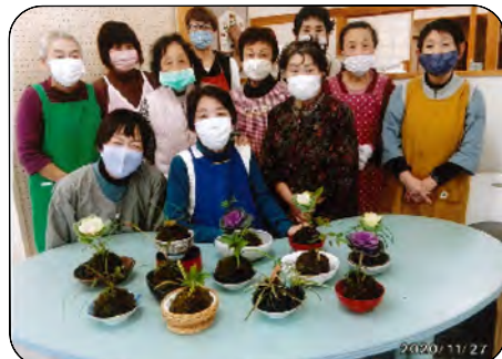
正月用に葉牡丹の苔玉をつくりました