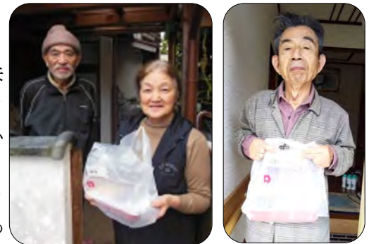
大変喜んで受け取っていただきました