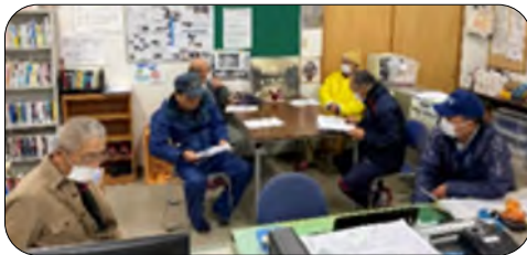
除雪ルートや開始時間を見直しました

東西町では毎年冬季に積雪が規定以上になると除雪ボランティアの方々にお世話になっていますが、今冬は次の10名の方々が名乗りをあげてくださいました。