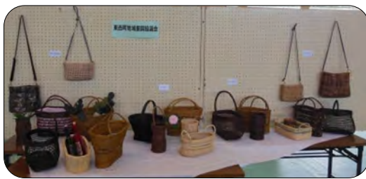
熱心な指導の成果、初心者とは思えない作品も