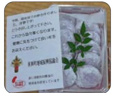
とてもきれいな芋もちが完成