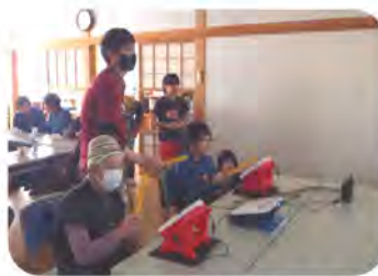
2セット準備していただき4名づつ交代でプレーしました