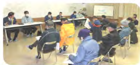
11名が出席し説明を聞きました