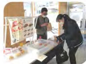
噂のスコーンショップ

健康にも良く子供から高齢の方までみんなで楽しめる「eスポーツ」をこれからもこのような機会を作って行きたいと思っておりますのでご参加ください。