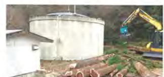
↑アフター 杉で隠れていた第二配水池