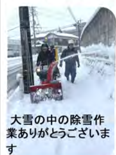
大雪の中の除雪作業ありがとうございました

除雪隊での除雪は子どもたちの通学バス乗車の安全が優先となりますが、出来る範囲は除雪するように心掛けていますので、ご理解をお願いいたします。