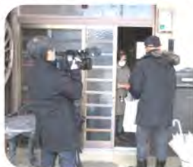
「無事ですタオル」配布の取材にご協力いただきました4区1班の皆様ありがとうございました。