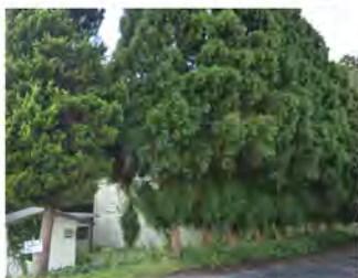
↑ビフォー 大きく成長した杉の木