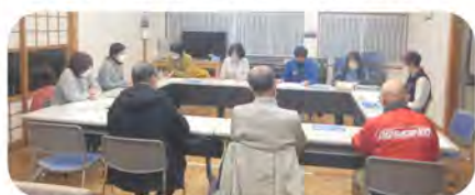
地域課題について話し合いを行いました