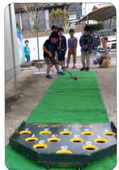
スカットボールでスカット！