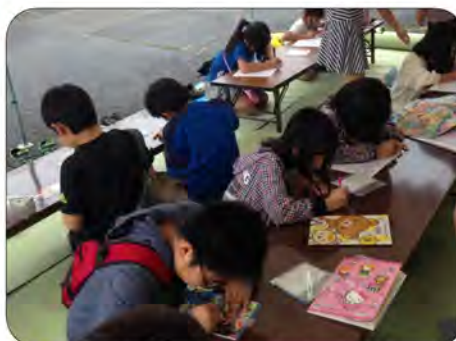
大人気のプラ板ストラップづくり