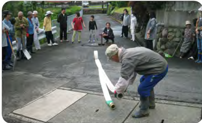
清掃後、消火栓のバルブ作動確認や、ホース格納箱の点検をされた班もありました