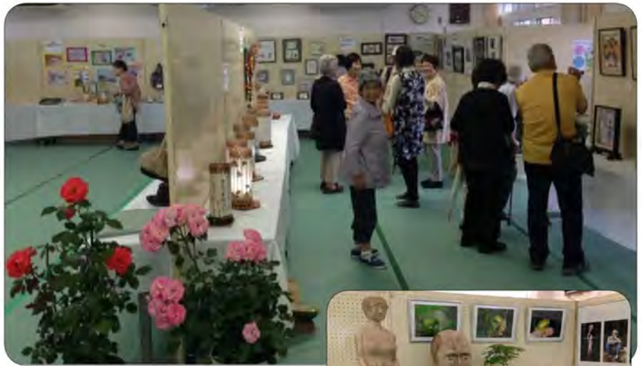
会場一杯に展示された作品