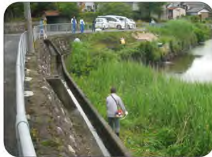
牧田池の草刈りに汗を流す町づくり部員

6月5日(日)春の一斉清掃が行われました。たくさんの方々が参加され、おかげで地区全体がきれいになりました。