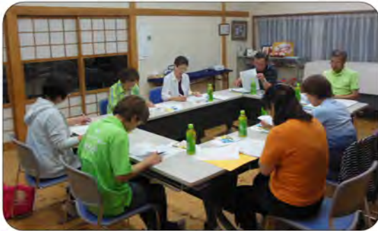
4区の見守り検討会

今年も全ての区毎に、区長、民生委員、福祉部員、地域福祉委員、事務局が集まり対象者の見直しを行いました。65歳以上の独居者や80歳以上の高齢者のみの世帯で、見守りが必要の方には、本人の希望をお聞きして、灯火の確認、窓の開閉等で見守り活動をしています。