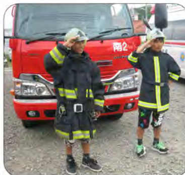
消防服を着て決めポーズ