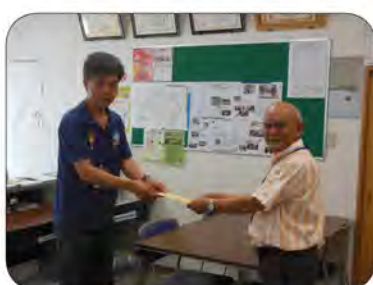
社会福祉協議会にお預けしました