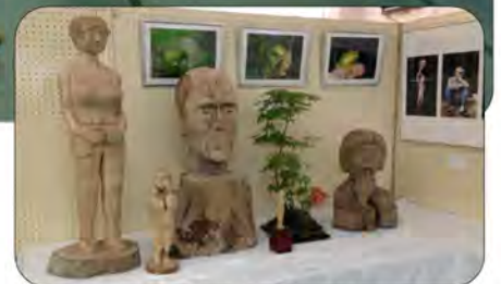
美術館の展示と見間違ふような作品も・・・