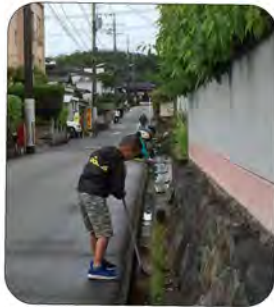
一生懸命溝掃除をしている頼もしい小学生!