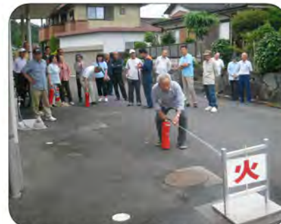
イザという時に慌てることのないように何度でも練習しましょう!

救急講習の後、火災通報・避難・消火訓練が行われました。イザという時のために、皆さんメッチャ真剣。どんな訓練も繰り返して行う事が大切です。