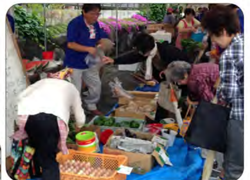
慣れない野菜販売に悪戦苦闘の区長