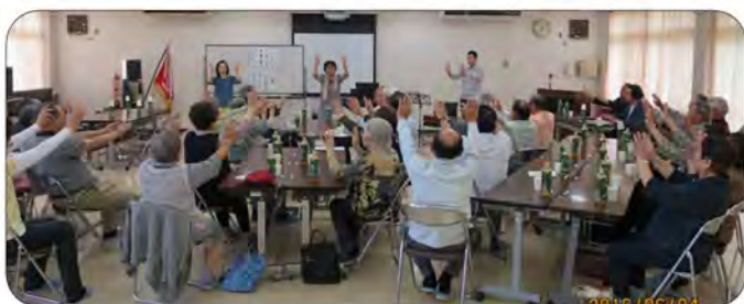
ゲームを楽しむ参加者