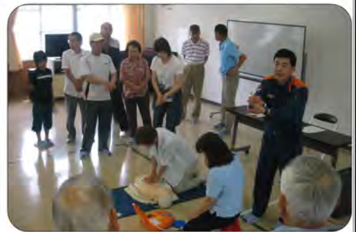
胸骨圧迫訓練 ギイガイ!