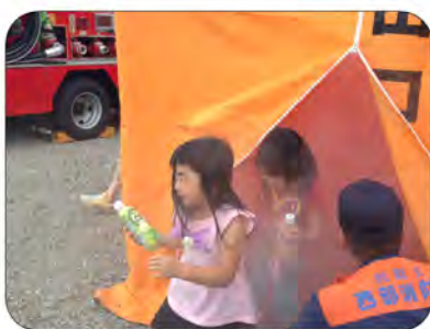
煙ってこんなにこわいの～！ 「煙体験ハウス」