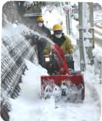
Aグループの除雪の様子

講習会の翌日、積雪が規定に達しましたので早速、Aグループのお二人に出動していただきました。ありがとうございました。