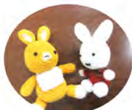
毛糸で編まれた千支「卯」

この一年が皆さまにとっても、東西町にとりましても良い年になることを祈念申し上げます。