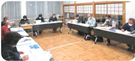
地域課題について話し合いを行いました