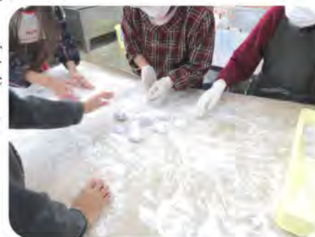
少数精鋭、熟練した皆さんの手さばき

※該当の皆さんへのお知らせ文書の配布日程に余裕がなく、班長や対象の方にご迷惑をおかけしました。(事務局)