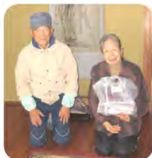
喜んで受け取っていただきました