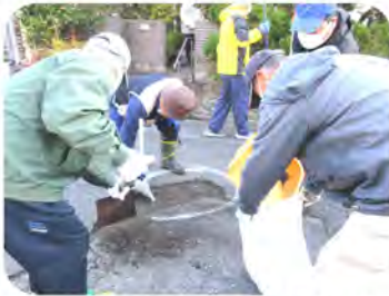
道路の穴埋め作業を行いました