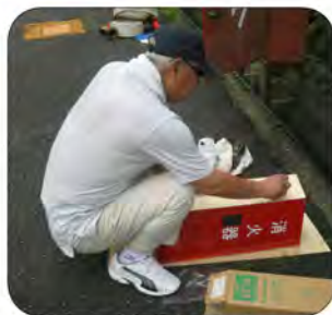
汗かくて作業する町づくり部員