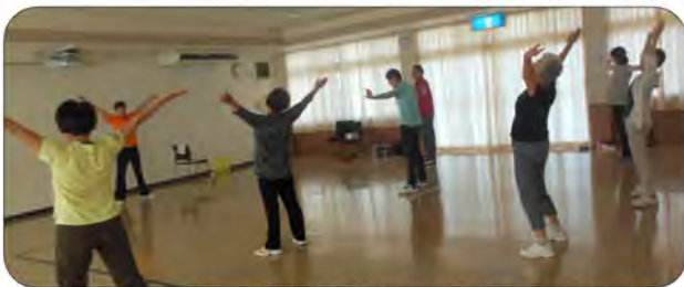
自宅でもできる健康維持方法として正しいラジオ体操を