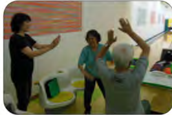
最高齢者のストライクでハイタッチ

6月26日(日)クイーンボウルで2回目となった東西町ボウリング大会を開催しました。