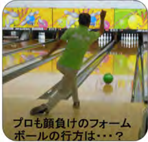
プロも顔負けのフォーム ボールの行方は・・・?

6月26日(日)クイーンボウルで2回目となった東西町ボウリング大会を開催しました。