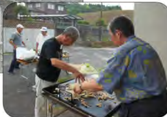
担当の焼きそばで接待 汗だくの男の料理