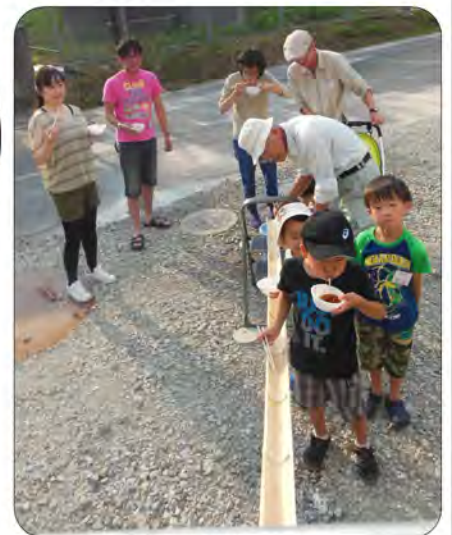
ジェット流しそめん