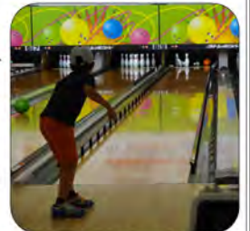
たおれてちょうだい～