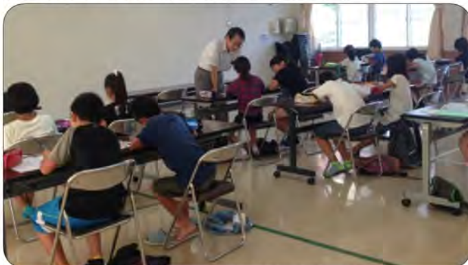
わからないところは地域の先生に質問

高校生を含めた地域の方5名に指導者としてお世話になり、23名の児童が参加しました。