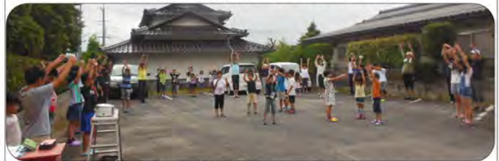
2区4班 新宝楽様駐車場 80名が参加した初日