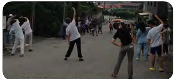
4区4班 第一設計様付近 みんなで第二体操まで