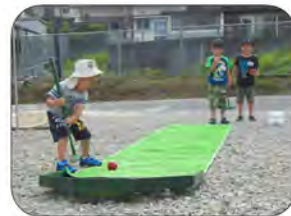
子供達もゲームあそびで交流