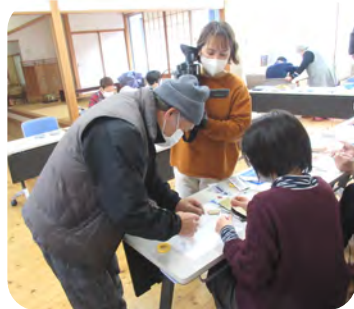
SDGSで今の時代にあった講座であると、なんぶSANチャンネルの取材を受けました