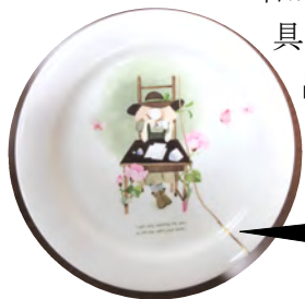
割れたところが景色になる日本の伝統技法を体験しました

お気に入りの割れた食器を10年もの間大切に保管し、いつか金継ぎを、と思っていた方等、やる気満々の10名が集いました。職人のような道具を準備していただいたものの、出来上がりはオリジナリティーあふれる作品になりました。