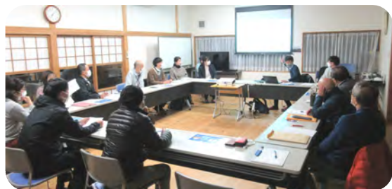
活発な質問が出た勉強会でした