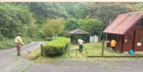
鎌倉山登山道入り口「こもれば広場」