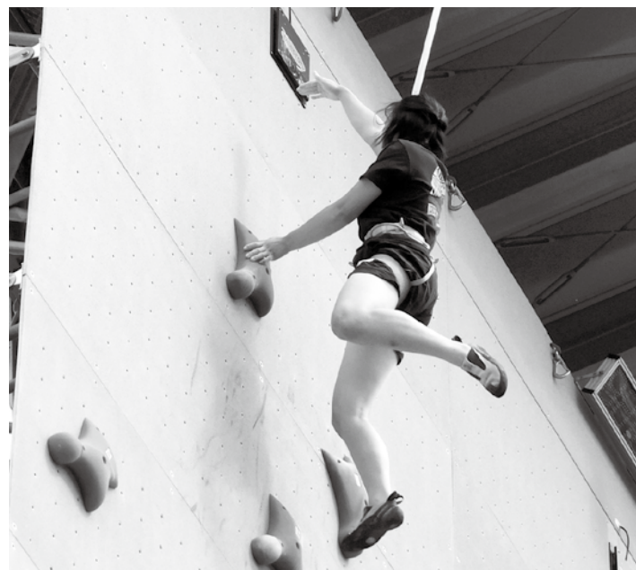
倉吉スポーツクライミングセンターで練習

中学2年生の頃に「スピード」のパリオリンピック育成事業に参加しました。スピードは自分が頑張った成果がタイムに反映されるので、やりがいを感じます。