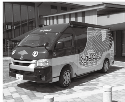
どこでもなんぶ号