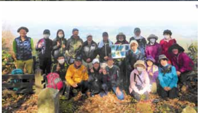
2020年に南さいはく地域振興協議会で地域を知る試みで計画された「かまくら登山」だが、その後はコロナ禍で実施できていない。