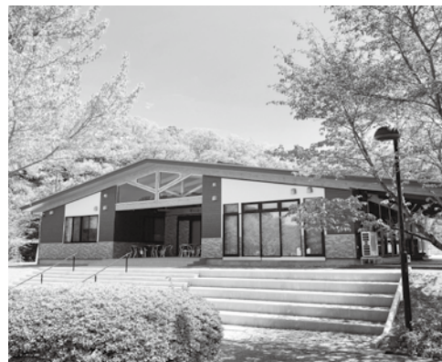
南さいはく交流拠点施設