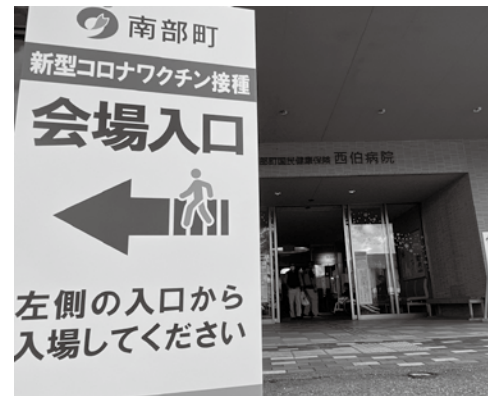
コロナワクチン接種