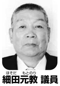
細田 元教 議員