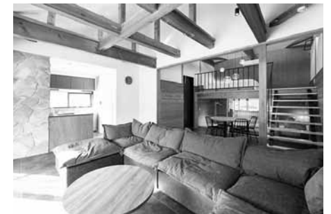
虹の村コテージ2番館