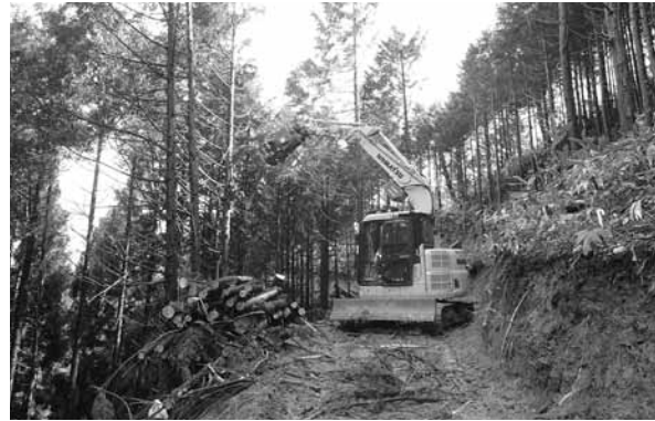
森林経営計画による森林整備