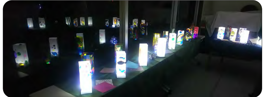
つどいのガラス戸に映って幻想的な異空間になりました