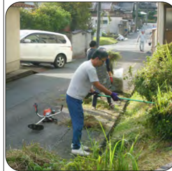
昨年秋の清掃の様子