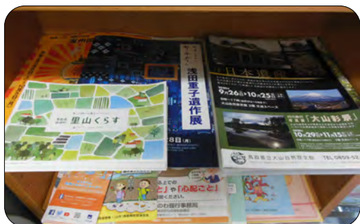
イベントのお知らせパンフレット

このコロナ禍で旅行を控えておられる方も多いと思いますが、気候も良くなりましたので、町内や近