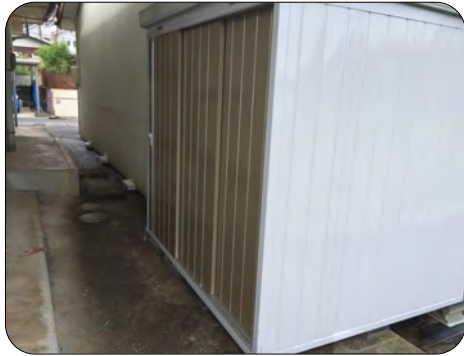
コミセン外倉庫裏(東側)に設置しました