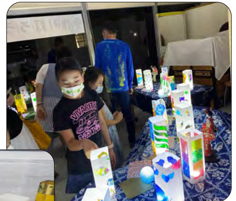
多くの方にご来場いただきました