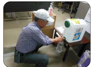
持参した容器に入れて持ち帰っていただきます。どうぞご利用ください。