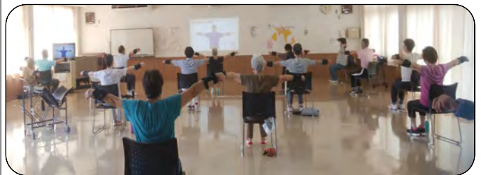
コミセンでの100歳体操