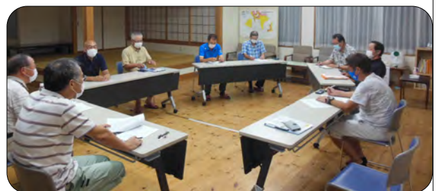
マスク着用と間隔を空けて開催しました