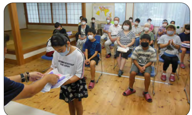
とても上手に受け取ることができました