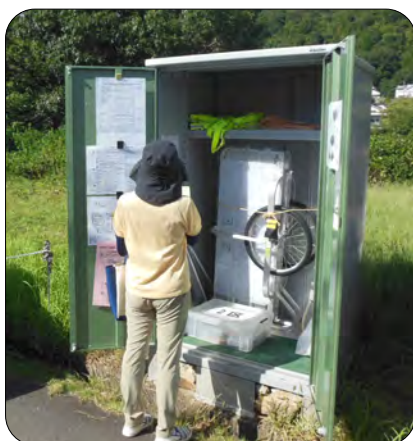
防災庫を整備しました