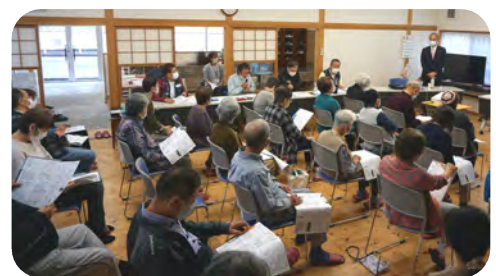
薬のウソ ホントが良~くわかったお話しでした