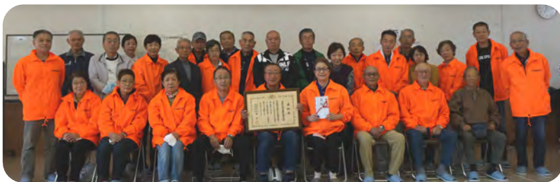
出席された安否確認協力委員・避難所対応委員

報告会では、東西町防災のターニングポイントとなった東日本大震災以降の防災活動について説明を行いました。安否確認協力委員・避難所対応委員の対応や、住民の皆様との協力で行ってきた様々な訓練等が高く