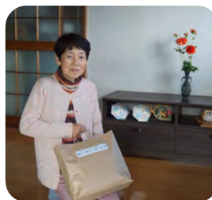
にこやかに受け取っていただきました