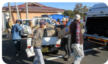
万寿会の皆さんの活躍に感謝です

今後ともリサイクル活動へ資源提供のご協力と、子供会、子供育成会の方々は回収への参加協力も宜しくお願い致します。