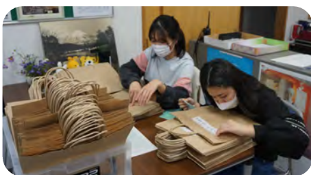
袋に名前シールの貼り付けもお手伝い してくれました。(西伯小5年)