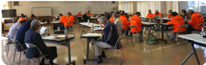
意見交換会会場の様子

⑤委員の任期について等の説明や意見交換を行いました。①は4区から3区に抜けるスロープに段差があることや、地震等で電柱が倒れると、高圧電流が流れているので危険である等の報告や前向きな意見がありました。⑤は東西町の皆さんが災害時に自分で判断して行動できるようになるまで、お世話していただきたいと事務局からお願いしました。委員から「年齢は関係ない、自分が元気なうちは協力しようと思う」というとてもありがたい発言もありました。