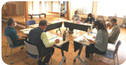
会計2名、監事2名、事務局3名で行われました

11月4日(金)つどいで中間監査が行われました。2名の監事によって、令和4年度の前期における東西町地域振興協議会各会計の執行状況や口座残高の確認をしていただきました。