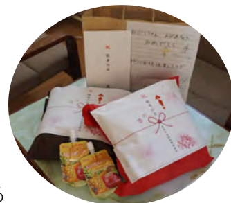
お届けした記念品

記念品へのお礼や、手紙やイラストに心が熱くなったという喜びの声も寄せられました。