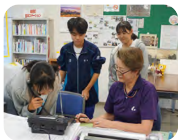
お祝いメッセージ録音の様子 (法勝寺中2年 3名)