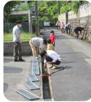
←協議会に入っていないアパートの方も総出で清掃をされていたいました。

町づくり部では、会員の要望等に対応して、今年の内小規模な舗装修繕やカーブミラーの清掃・方向修正等を計画しています。該当箇所の近隣の皆様にはよろしければご協力をお願いいたします。