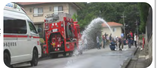
放水を行っているのは女性 イザ!