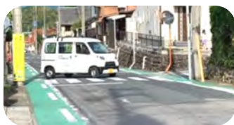
ボランティアでパトロール

6月1日～7月31日まで防犯パトロールを実施しています。今季は8名のボランティアの方々にご協力いただき区内に不審な人や車、危険な箇所は無いか等のパトロールをしています。気温が高くなり、窓や戸を開けることが多くなりますが、少しの時間