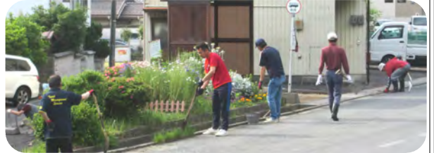
4区2班はバス停の周囲も清掃を行われました。↓