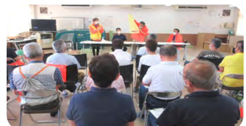
黄色の「大丈夫ですタオル」を提案しました