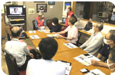
活動のビデオで説明を聞きました