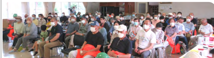
地震防災講演会を熱心に聞く参加者

講演会終了後、安否確認協力委員・避難所対応委員の皆さんへ、安否確認の負担軽減策として、自身で安全を知らせる「大丈夫ですタオル」を全戸に配布することを事務局から提案し、了解していただきました。最後に反省会を行いました。今回の避難訓練には78名の参加があり、皆さんには家具の下に敷くことで前傾止めになる地震防災グッズを進呈しました。