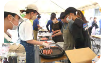
久しぶりに各育成会による屋台