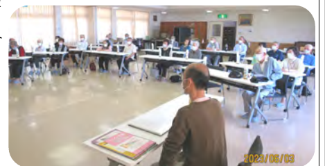
シニアのつどい開会の様子