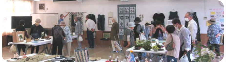
展示室には地域の方の力作が並び、たくさんの方にご覧いただきました

さつき祭のメインである作品展示には、講座や同好会等の作品や趣味の作品も数多く展示され、東西町の皆様が多趣味であることを今年も実感しました。