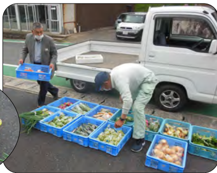
野菜を搬入し開店準備