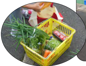
かごにいっぱい 買い求められた野菜