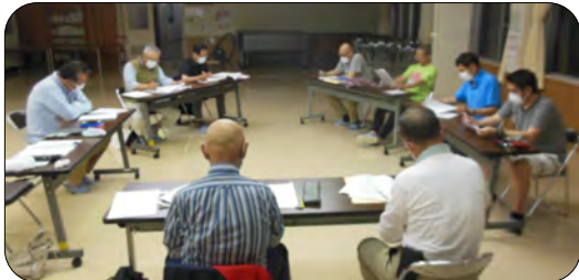
書面表決の議決を受けて 第1回の運営委員会を開催しました

5月24日(日)令和2年度の第1回目となる運営委員会を開催しました。コミセン(大集会室)の広い部屋で、間隔を広く取り、窓を開け、マスクを着用するなどのコロナ対応をして、区長・部長・事務局計10名で会議を行いました。