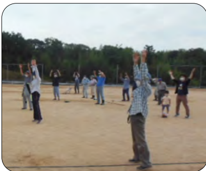
手が伸びた美しい体操