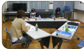
3者の打ち合わせ会の様子