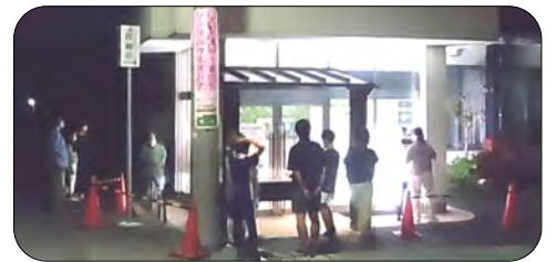
多くの方が来られ、ガラス越しに鑑賞されていました