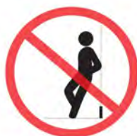
ガラスに寄りかからないように

7月につどい玄関のガラスが割れて子ども達が怪我をしたことがありましたので、修理後にガラスが飛び散らないようにフィルムを貼っていただきました。きちんと待つように指導をお願いします。