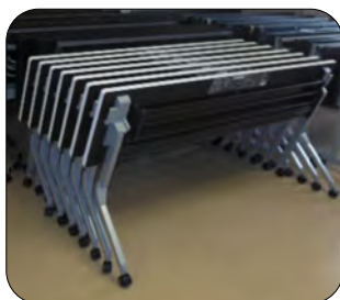
スッキリと片付くテーブル

キャスターが動きにくくなった古いテーブルを少しずつ交換していきます。優しく扱ってください。