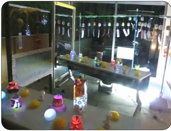
点灯した灯籠もきれいでした

子ども育成会、中学育成会、青少年育成会の合同お楽しみ会として「手作り風鈴の展示と灯籠の点灯会」を行いました。