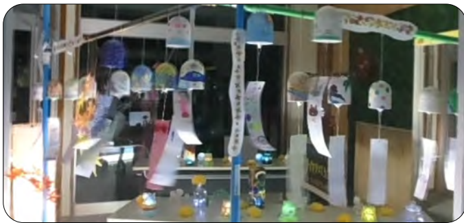
扇風機の風でゆらぐ風鈴、展示方法に苦労しました