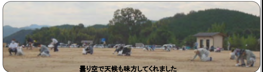
曇り空で天候も味方してくれました