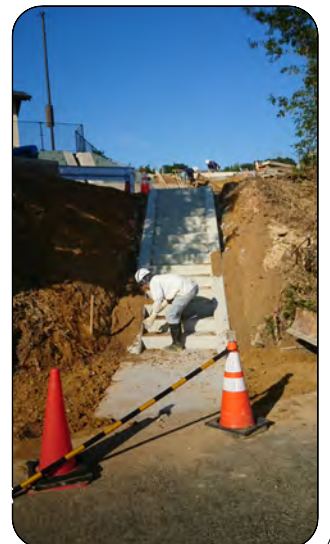
コミセン側から東西町スポーツ広場につながる階段設置工事