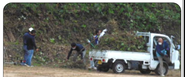
刈る・積む・運ぶ、さすが息のあった東西町チーム