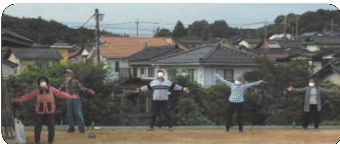
ラジオ体操もソーシャルディスタンス