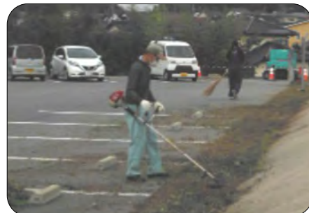
←駐車場の草刈りと清掃