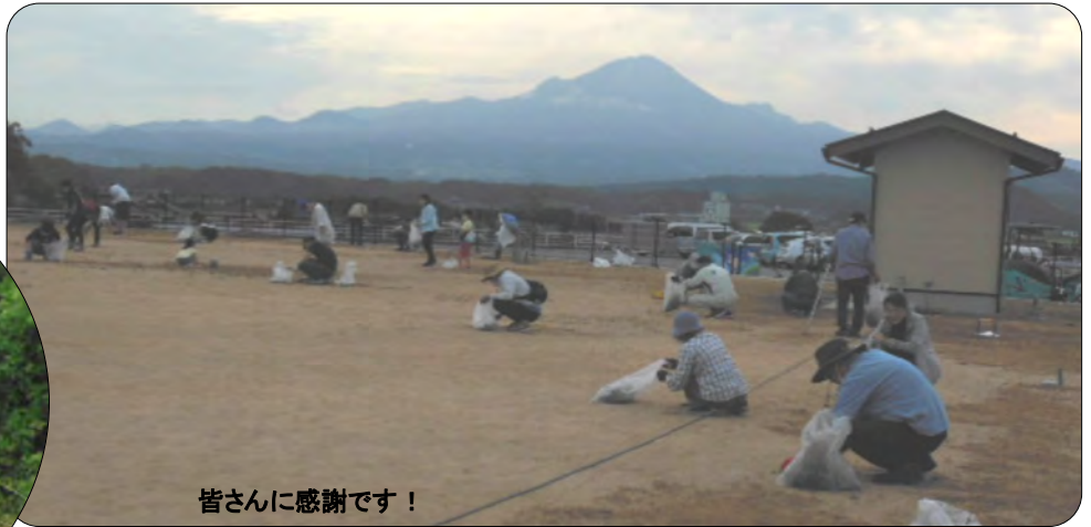
皆さんに感謝です!