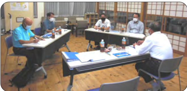
活発な話し合いが行われました