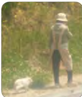
ネコもリードで散歩

また、この時期に除草材を蒔くこともありますので、ペットを飼っている方はご注意ください。