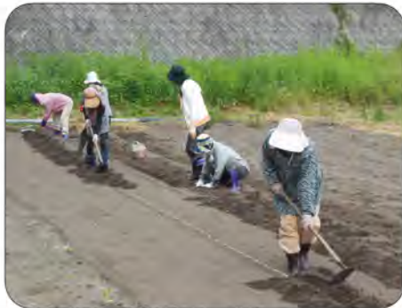
参加者の鍬を持つフォームも年々上手に

5月24日(火) 消費地である当 地区と、野菜市 やわくわくショッ プで販売してい ただいている日 南町の農家さん との連携をより 一層深めるため、 交流会を開催しました。