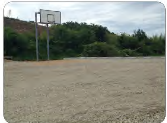
バスケットゴールも北側に移設しました