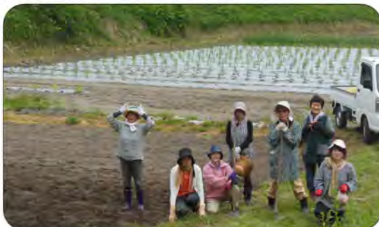
広大な畑の中で生産者の方と一緒に

昼は、畑から採れたての野菜でバーベキューをし、 安全な野 菜である ことを味 わって確 認しまし た。