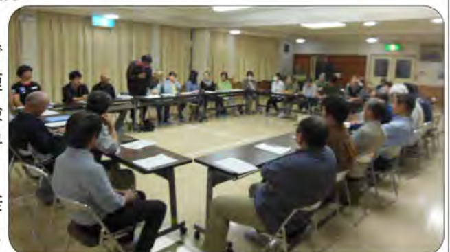
全体会議の様子～多くの方々の協力で開催することができます～

また、昨年100名以上が参加されるほど好評だった健康福祉館での健康チェック、同好会や教室、各種団体による屋台村も早い時期から準備をしていただきました。