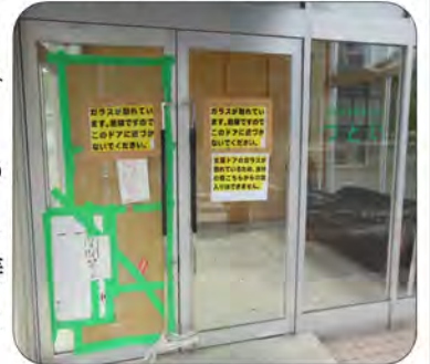
危険です！近づかないください

その間、危険ですの でドアに近づかないよ うお願いします。修繕 後は必ず鍵をかけるよ うお願いします。