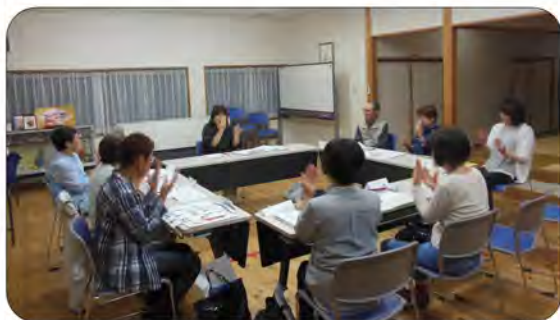
手話の輪が広がっています