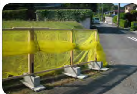
修繕されたごみネット3区3班

車の運転時交差点では特に気を付け、左折・右折 する時はスピードを落とすようにしましょう。