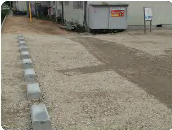
拡張され3メートル程奥行きが広がったコミセン北側駐車場