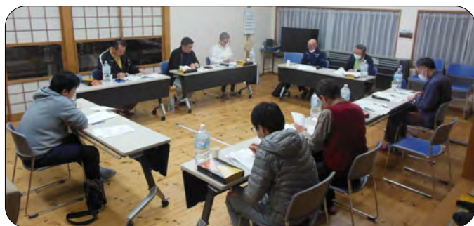
長時間に及んだ今年度最後の運営委員会