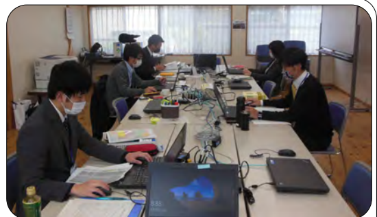
僅か2日で開設されたサテライトオフィス