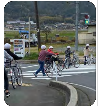
横断歩道は、自転車から降りて歩いて渡りましょう