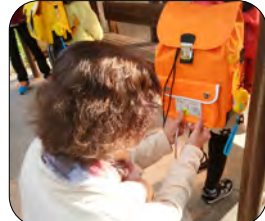
東町バス停でも無事を願いながら貼りました

新1年生に限らず児童全員が事故に会わないように、家族の方や地域の皆さまと協力して見守りなどを行うと共に、小学生の皆さんは登下校時に関わらず各自で常に安全対策を行い、自分の身を守って欲しいものです。