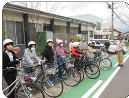
出発前の新中学1年生