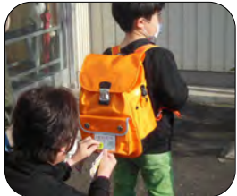
安全に通学してね!

毎年福祉部の行事として部員の方に協力いただいています。今年度の小学新1年生8名に、つどいと東町バス停の2箇所で通学時の安全を願って、反射材の貼付けをしました。