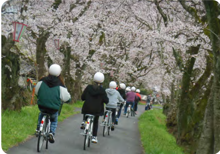
桜のトンネルをくぐって通学します。事故のないように安全を願います

新型コロナウイルスの感染拡大の影響で全国各地で様々なイベントや行事が自粛される中、青少年育成会主催行っている中学新1年生の自転車通学路確認は、中止も検討しましたが、保護者からの強い要望もあり、保護者の付添自粛、マスク着用、健康状態の事前チェック等の対策をして、3月29日(日)に延期し実施しました。