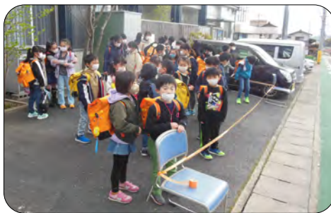
当分の間、バス待ち場所をつどい駐車場にしました

マスクをすることや、バスの中で話をしない、手洗い等について、ご家族でも、話し合ってください。