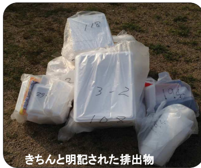
きちんと明記された排出物

特に時間外に排出される中に無記入のものがあるようです。いつまでたっても当番廃止ができません。