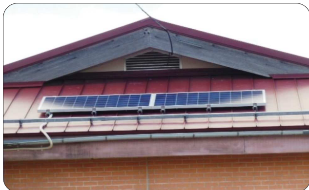
コミセン南側屋根に設置されたソーラーパネル