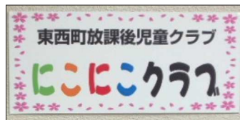
看板も設置しました