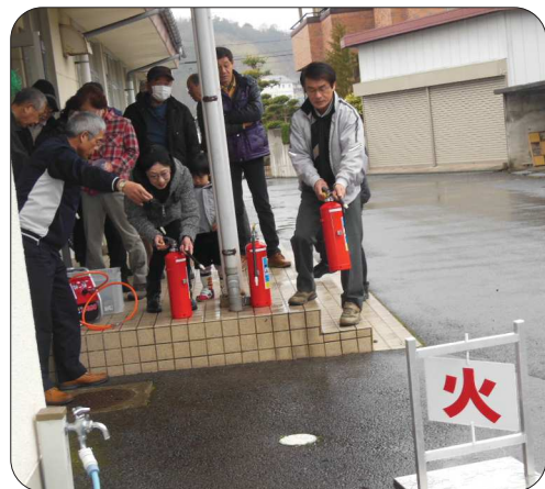
参加者全員が水消火器の体験をしました