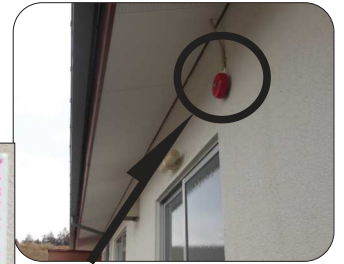
外壁に設置した非常通報ベル

近隣の方や散歩中の方で、この非常通報ベルが聞こえたら、集会所に駆けつけていただきたく存じます。子供達の安全のために、何卒お力添えをお願いいたします。