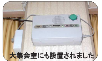
大集会室にも設置されました

昨年の避難訓練の際に要望としてでました、大集会室へデジタル防災無線端末器の設置がこの度完了しました。