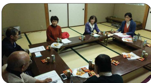
3区の見守り世話人懇話会の様子

最も重要なのは隣近所や班内で、日頃からお互い様の気持ちを持ち合うことだと思います。