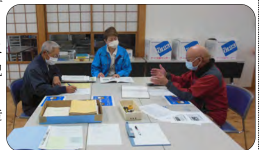
先月から立ち上げた編集委員会 2月は3回の編集会議を行いました