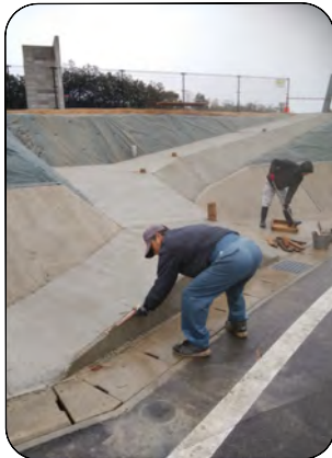
雨の中の工事 2月26日