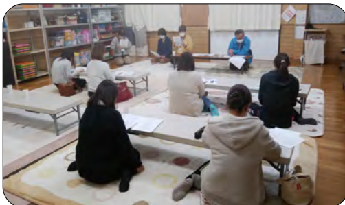
利用児童の保護者へ説明会を行いました

新年度の利用者は8名です。どうぞ温かい気持ちで接していただきますようお願いいたします。