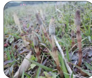
散歩途中、法勝 寺川土手で見か けた初土筆(つく し)2月24日