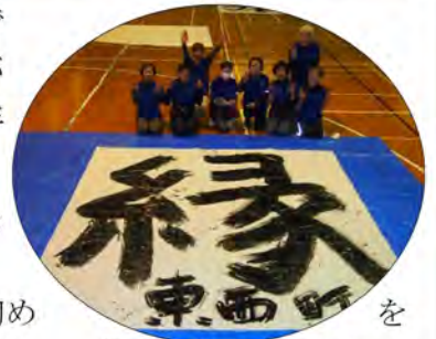
縁で結ばれた東西町チーム

1月17日(日)町体で南部町書き初め大会が開催されました。今年も、遊友くらぶを中心としたメンバー8名が出場しました。