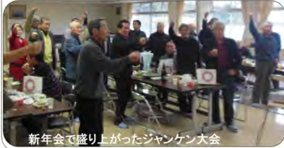
新年会で盛り上がったジャンケン大会

スタートしました。南部町の事例発表会のために制作したパワーポイントで東西町の取組み『住民の参画がどのように形成されてきたか』をご覧いただきました。そして定番となった『イリュージョン』はやはり期待を裏切らない?出来栄でした。参加者は40名でしたが、非常に和気あいあいの新年会となりました。