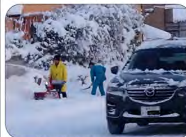
除雪機とスコップで雪かき

1月25日(月)前日から降り続いた雪が27センチになりましたので、今期初の雪かき隊が出動し、バス停や歩道の除雪を行いました。ありがとうございました。