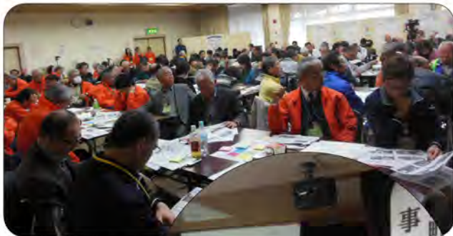
熱気あふれる 会場の様子

会場には町内外から約150名が来場され、ワークショップ形式で質問や意見をポスト・イットに書き込んでもらう手法がとられ、東西町の発表では「エコポイントについてもっと詳しく知りたい」や「団地特有の地縁血縁が薄い集落と思っていたが住民参画がうまく出来ている」「コミュニティはどのように創られたか」等々たくさんの質問や意見があり、関心の高さが伺われました。今後も、住民の皆さんと共に東西町の町づくりを進めていきたいと思っておりますので引き続きお力添えをお願いします。