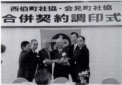
▲ 合併に向け、固い握手

南部町社会福祉協議会発足へ 西伯町・会見町社会福祉協議会合併調印 西伯、会見両町の社会福祉協議会合併契約調印式が、三月二十四日(水)会見町総合福祉センターで行われました。 十月二日南部町の誕生と同時に「南部町社会福祉協議会」が発足します。南部町社協の本所、西伯支所は西伯町総合福祉センター内に、会見支所は会見町総合福祉センター内に置かれ、それぞれ現在行っているサービスは当面継続されます。 両町社協は昨年六月に合併協議会を設立し、協議、検討を重ねてきました。今後は、五月中に新法人設立の認可を鳥取県に申請する予定です。