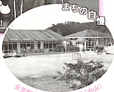
会見町立ひまわり保育園(市山)

大山が見える小高い丘の上の赤い屋根が目印 ひまわりをモチーフにした鉄筋コンクリート平屋建