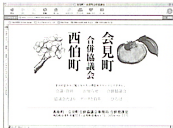
ホームページを開くと、こんな画面が出ます