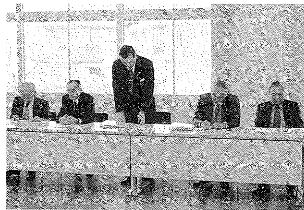
坂本会長、視察のお礼のあいさつ