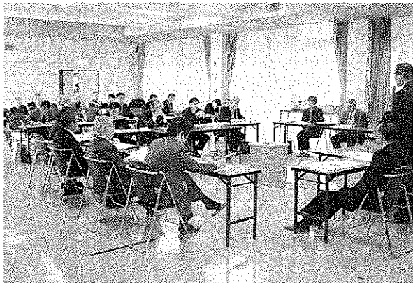
活発な議論の場となった第2回協議会

西伯町・会見町合併協議会では、新町建設計画策定のためのまちづくり委員を募集します。西伯・会見両町から各五十人の合計百人で構成し、年齢は十八歳以上として原則男女同数とするなどの募集内容を決定しました。