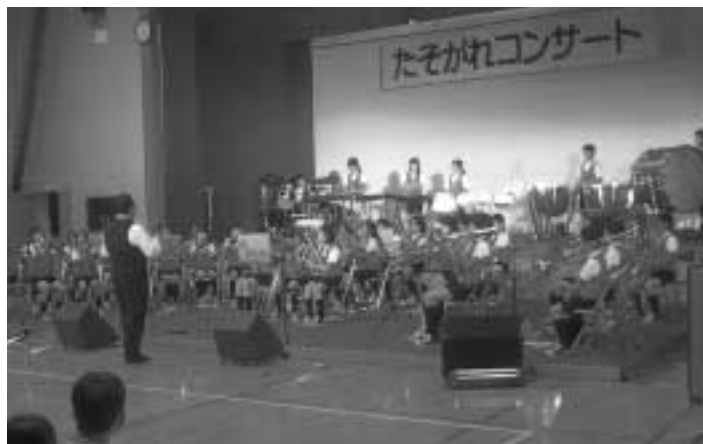
西伯小学校の皆さんの演奏です

恒例になった「たそがれコンサート」を、10月11日ふるさと交流センターで開催しました。