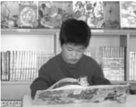
読書にはげむ会見小学校の子ども

会見小学校では、昨年度から家庭での学習習慣の定着と基礎学力の向上を目指して『パワーアップ週間』を実施しています。今までのアンケート結果から休日の学習時間が極端に少ないことが分かったので、このパワーアップ週間には、必ず土・日を含めるようにしています。