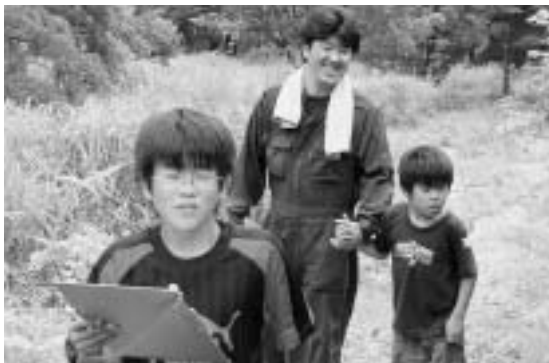
親子で挑む フィールドワーク！