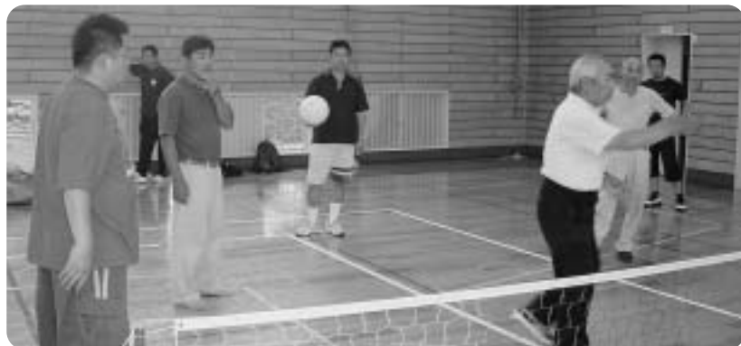
ルール説明を受けながら

この種目は、鳥取で生まれた新しい生涯スポーツです。子どもから大人まで、年齢、性別に関係なく気軽に楽しめます。