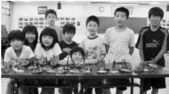
素敵な作品ができたよ