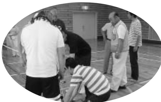
用具の組み立ても学びました