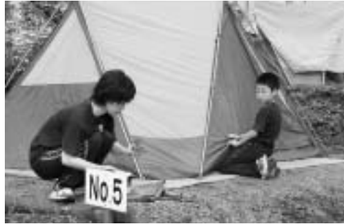
まずはテント設営

7月16日から2日間、船上山少年自然の家で小学生の親子を対象としたファミリーキャンプを開催しました。親子のふれあいの機会を作ることを目的に始まったこの教室、昨年よりキャンプを行っていて、今年も親子で協働してテント設営や野外炊飯、ネイチャーゲームなどをしました。なかでもまず返し滝では滝つぼが天然のプールになっていて、子供たちは普段泳ぐ機会の少ない天然プールで泳いで楽しみました。