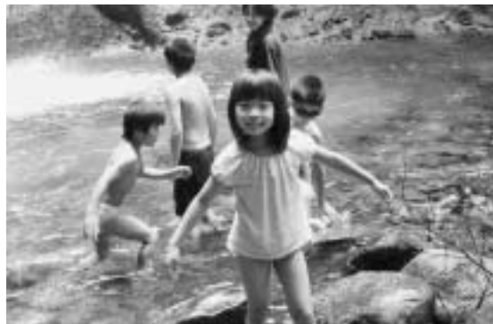
滝つぼは ひんやり気持ちいい！