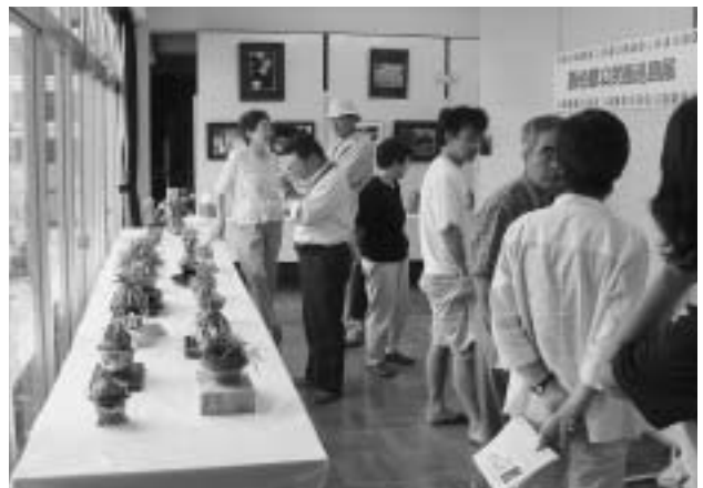
大小の鉢が並んだふうらん展

7月12日から3日間、ふうらんの会のみなさんによるふうらん展が開催されました。花のきれいなときのピーク見てもらうため3日間という短い日程ではありましたが、町内外から多くの愛好者が訪れていて、様々な種類のふうらんについての説明を受けていました。新聞やテレビの取材もあり、3日間で200人近くの方が訪れました。