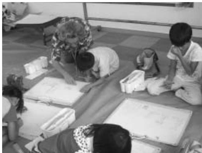
先生のアドバイスで、いい絵になったよ。（水彩画）