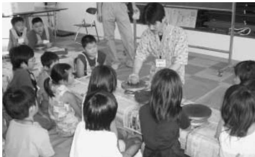
見ると簡単そう。でも実際にやってみると、難しい！（陶芸）