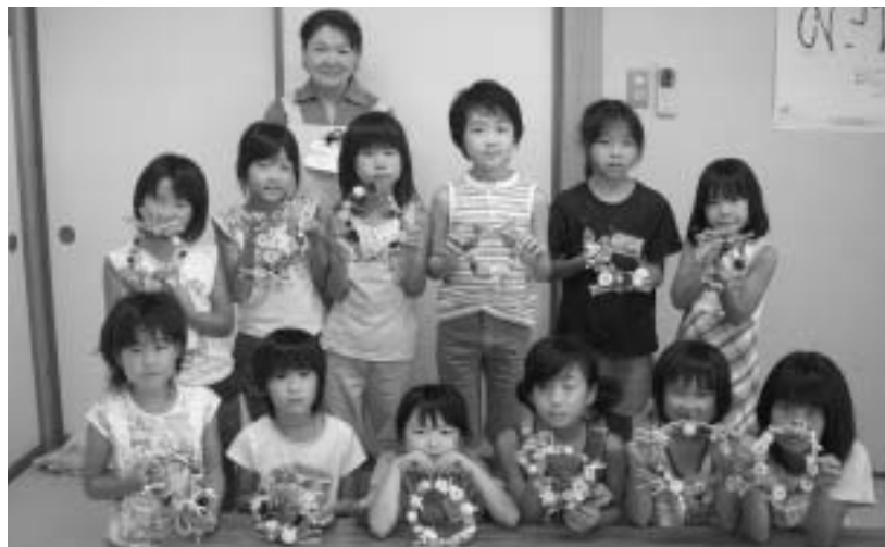
自分で作った素敵な作品と一緒に記念撮影（花のリース）