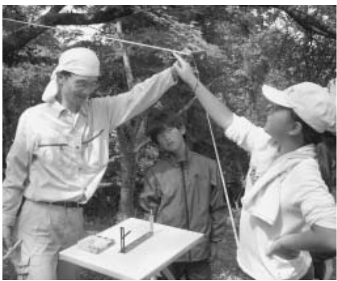
古墳の測量体験に挑戦

鳥取県埋蔵文化財センターと町教育委員会との 共催で、「子ども考古学探検隊」が開催されました。 町内の小学生が参加し、南部町の史跡めぐり、 古墳の測量体験、土器づくり、土器の野焼きなど、 貴重な体験をしました。子ども達は、南部町が神 話や文化遺産の多い歴史ある町であることを実感 しました。