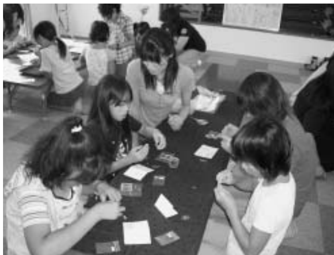
子ども達は意外に上手。「家でも作ってみたいなあ〜。」（ビーズ）