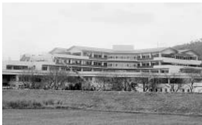
(写真1) 新病院の建物本体