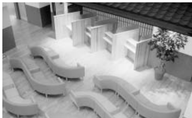
(写真2) エントランスホール

エントランスホールは、南部町で製造した杉集成材を使用するなど、和風の柔らかい雰囲気になっています。(写真2)