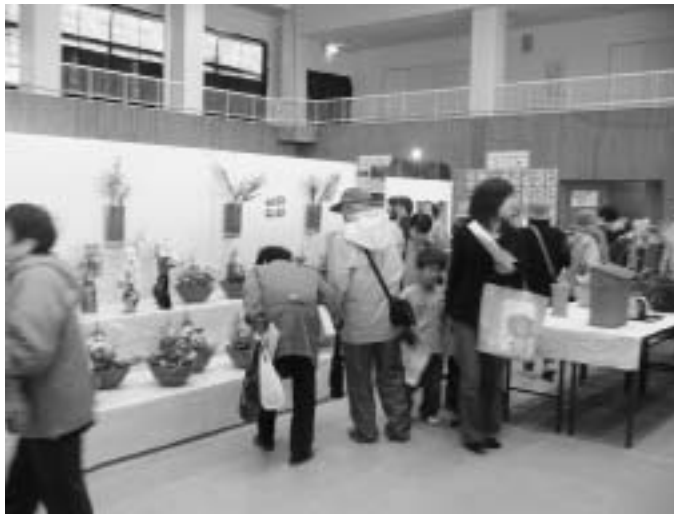
3日間で約1,100人の方が来場

11月18日(金)から20日(日)の3日間、農業者トレーニングセンターにおいて、「生涯学習作品展」が行われました。日頃の成果発表として、保育園児や小学生、公民館クラブ・団体グループ・個人による1,060の作品が展示されました。