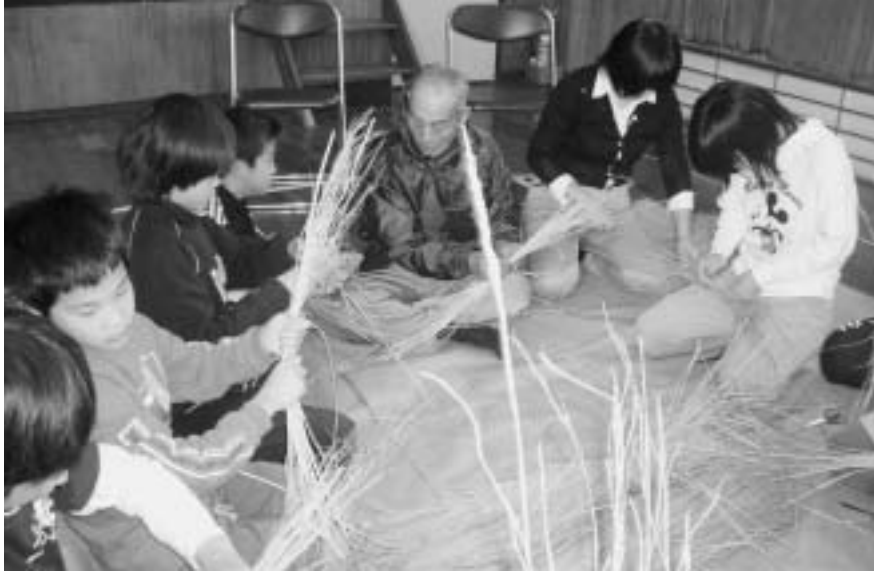
うまくできると いいけどなあ