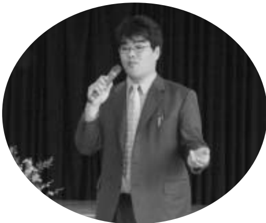
おもちゃの効用を熱っぽく語られました

「おもちゃには、大人が幼児と関わるよさや発達を促進する効果がある。また、ルールの理解や勝ち負けの体験は社会性の発達につながる。しかし、そのベースは生理的な安定（生活リズム）と精神的な安定（人間関係）である。」というお話でした。