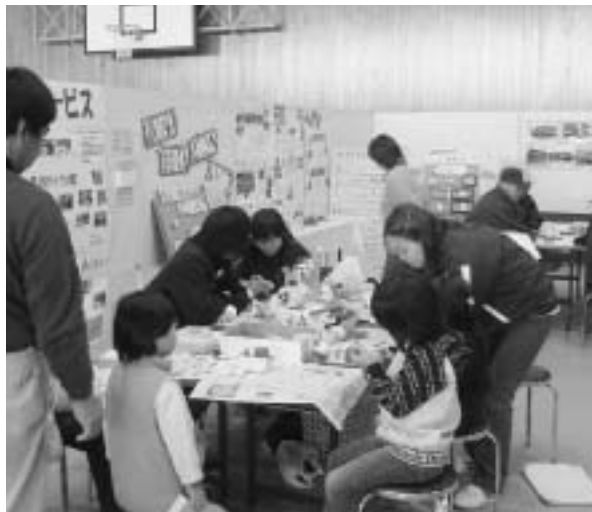
中学生もボランティアとしてお手伝い