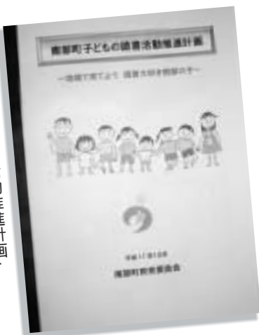
「南部町子ども読書活動推進計画」

した。南部町においても策定委員会を立ち上げ、数回にわたる審議を行い、平成17年10月1日に「南部町子ども読書活動推進計画」を策定しました。今後、この推進計画に基づき、各関係機関と連携し、子ども達の健全な成長を支える読書環境をつくっていきます。