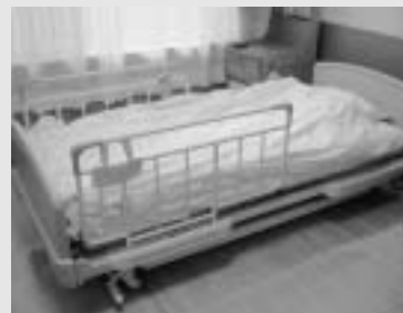
低床型電動ベッド