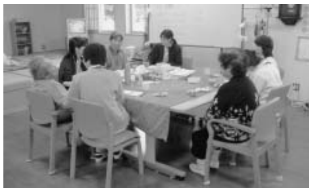
デイケアらくらくの様子

この制度を利用すると精神疾患の通院治療の医療費自己負担が軽減されます。精神疾患等のために継続的な通院医療が必要な方がこの制度の対象となります。(平成18年4月制度改正あり)