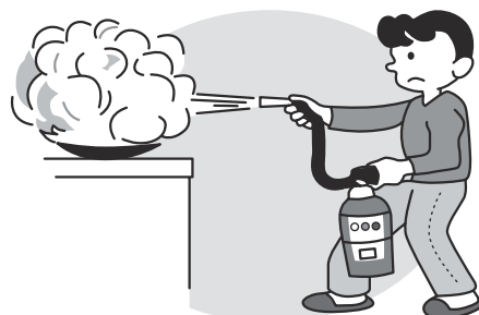
③レバーを強く握って放射する