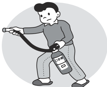
②ホースを外し火元に向ける