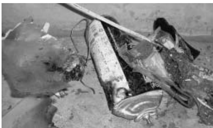
平成18年1月20日(金)午前11時10分ごろ、リサイクルプラザの不燃ごみ前処理破砕機内において、爆発したカセット式ガスボンベと類焼の状況

鳥取県西部地区の不燃ごみ、資源ごみの処理を行っているリサイクルプラザの破砕機内において、穴を開けずにごみとして捨てられたカセット式ガスボンベ、スプレー缶などが原因と思われる発火事故が、今年に入ってから続発しており、安定的な処理にたびたび支障を来している状況です。