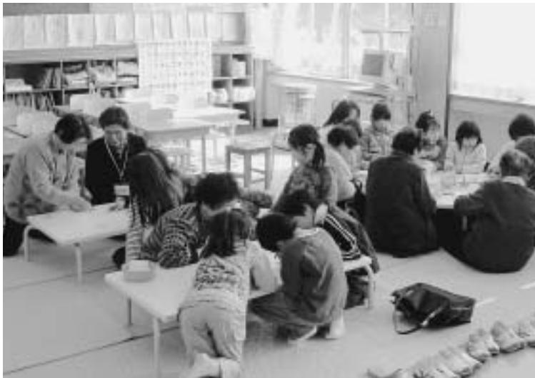
子供たちに昔の遊びのてほどきを

最近ではあまり手にすることがない遊び道具に悪戦苦闘しながらも、だんだんとなじんでいく姿に高齢者の方も嬉しそうな眼差しで見えておられました。