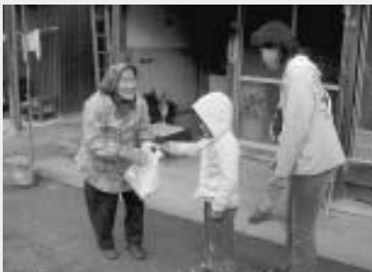
おもちを配って回りました

このもちつき大会も平成5年から始めており、今後も続けていきたいと思えます。午後からはしめ縄教室を行いました。指導者に習いながら、輪締めや自動車用のしめ縄を作りました。いい正月を迎えられたことでしょう。