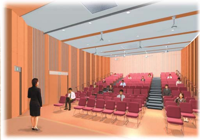
3階 ホール (イメージ図)

現在は1階図書館の工事に着手しており、12月には全体が完成し、来年1月オープンを目指しています。