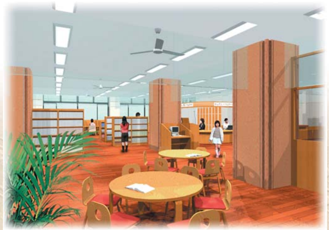
1階 図書館 (イメージ図)