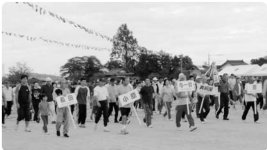
選手入場行進で盛り上がりました