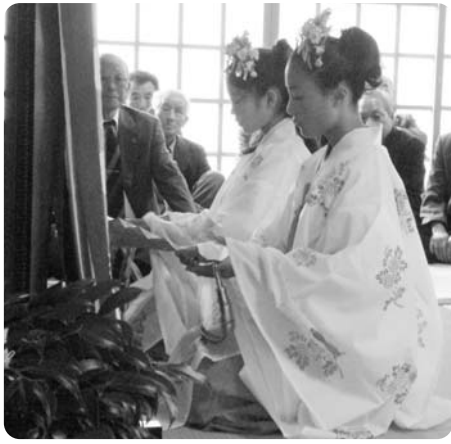
緊張した面持ちの舞姫

今年、年賀を迎えた氏子や、参拝に訪れた方々に舞姫の2人が「浦安の舞」を披露し、秋晴れの空の下、華麗に舞い踊りました。2人は「緊張したけど、うまく踊れてホッとした」と話していました。