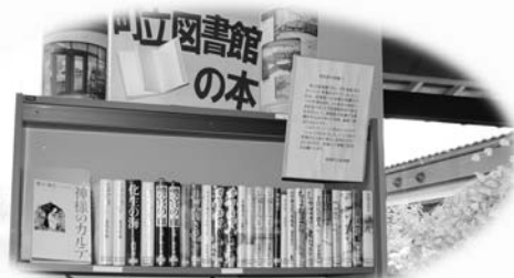
配本ステーション事業の様子 (いこい荘)