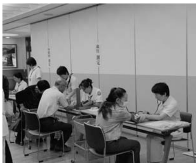
過去の看護フェアの様子