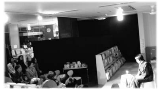
前回の様子（平成25年3月9日・天萬図書館）