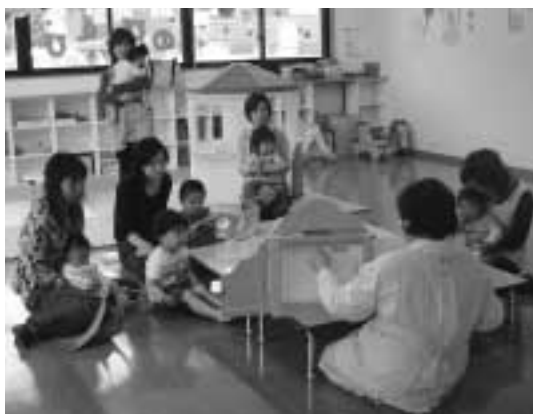
こいのぼりのおはなしを聞く親子（5月8日：のびのび）

5月8日の「こいのぼり作り」にお邪魔しました。この日は、4組の親子が参加されており、受け付けを済ませると、あいさつをして、まずは簡単な手遊び。その後、こいのぼり作りを始めました。参加した子ども達は、紙で作られたこいに、思い思いの千代紙で模様をつけ、鮮やかなこいのぼりを完成させていました。最後、こいのぼりの歌やおはなしをして行事が終わりました。