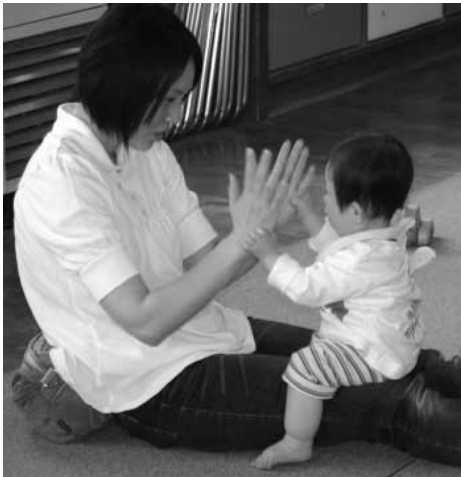
手遊びを楽しむ親子（5月17日：あいあい）

家庭を取り巻く環境が大きく変化し、子育ての不安や悩みも多様化しています。南部町では、子育てを応援する様々な取り組みが行われています。不安や悩みが大きくなる前に、自分に合ったサービスマスや場所を見つけて、楽しく子育てをしませんか。